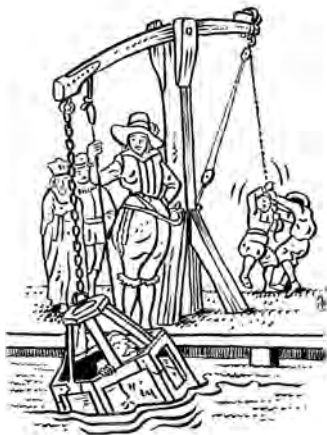
Máchání nepoctivého pekaře ve vltavské vodě v „koši“ z dřevěných latí.

Když se hovoří o pražských pekařích, obvykle padne zmínka o máchání šizuňků v „koši“ ve vltavské vodě a o Václavu IV. (1378–1419), který v přestrojení nakupoval „kontrolní“ chléb na Starém Městě (kam se kolem roku 1383 přestěhoval z Pražského hradu do nově vybudovaného Králova dvora u dnešní Prašné brány). Tresty prý vynášel na místě. Někdy rozdal nepoctivcovo pečivo mezi chudé a jindy stanovil pro pekaře pokutu, kterou bylo možno buď uhradit penězi, voskem či pivem, nebo pobýtem na pranýři. Šlo o tzv. „suchý“ trest, při němž musel nepoctivec především v době trhů, kdy kolem chodávalo mnoho lidí, stát v koši či v kleci třeba hodinu dvě otočen obličejem ke kolemjdoucím, kteří mu měli vidět do tváře. Občas přitom míval na krku zavěšený svůj ošizený bochníček.