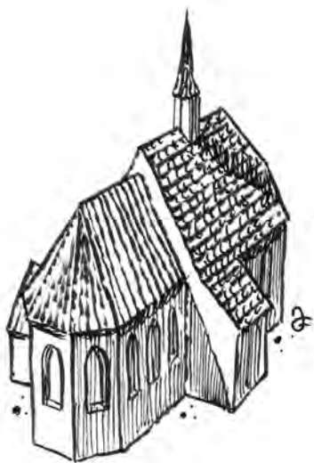
Takto vypadal první gotický kostelík z opukových kvádrů sv. Maří Magdaleny; nakreslen podle předlohy M. Semeráda z NPÚ Praha.

V letech 1315–1329 byl postaven na rohu ulic Karmelitské a Harantovy nebovidský kostelík sv. Maří Magdaleny , spojený se hřbitovem, doloženým archeology. Přibyl k němu i klášter magdalenitek, vše však zpusťořili husité, poté se měnili majitelé, kostel byl přestavěn na barokní, roku 1783 Josef II. oba církevní objekty zruřil a střídaly se v nich různé úřady. Dnes zde sídlí České muzeum hudby na adrese Karmelitská čp. 388/2 a za muzeem vede Nebovidská ulice, která tuto obec dodnes připomíná.