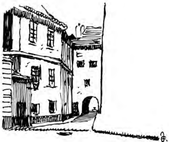
Druhý skromný špitál v Kanovnické ulici čp. 7317.

Podle Ruthovy kroniky onen špitál „úplně zašel za války husitské“, ale podle jiných pramenů existoval ještě v roce 1486 a možná ho prý stihl poškodit roku 1541 nešťastný požár Malé Strany a Hradčan.