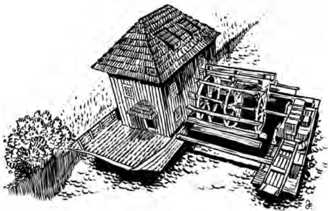
Takto vypadal lodní mlýn zvaný škrtnice.

Podle městských nařízení musel pekař takto umletou mouku využít výhradně k pečení, neboli ji nesměl rozprodávat.