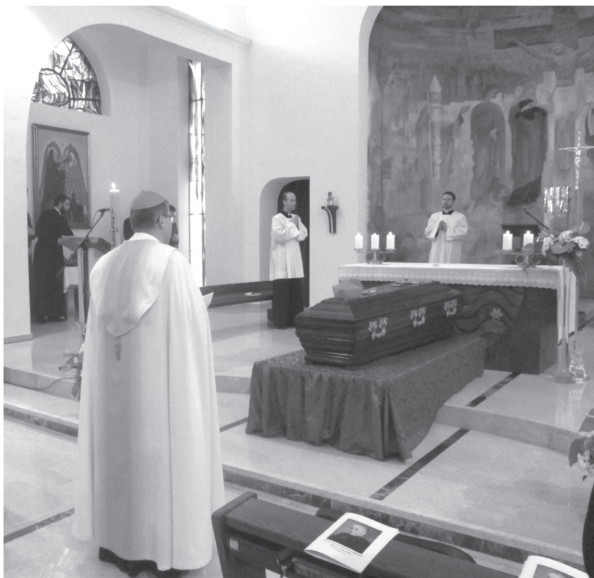
Mše v Nepomucenu v rámci přesunu ostatků kardinála Berana do vlasti v dubnu 2018

kdy za českou stranu signoval dokument premiér Petr Fiala. Na rozdíl od dojednané smlouvy z roku 2002, kterou schválil pouze Senát a naopak odmítla Poslanecká sněmovna, tento dokument na svých schůzích podpořily obě parlamentní komory během prvních měsíců roku 2025. Velké debaty se však rozvinuly o některých pasážích obsažených ve smlouvě, zejména kvůli tomu, že „Česká republika uznává zpovědní tajemství,“ což pokračuje druhým bo-