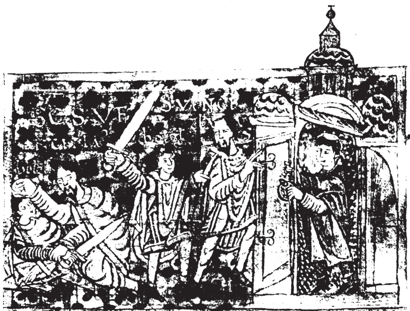
Nejstarší zobrazení vraždy sv. Václava z Gumpoldovy legendy (počátek 10. století)

badatele Václava Tatička, který někdejší Boleslavův hrad „odstěhoval“ přes řeku Labe na místo zámku v Brandýse a kostel sv. Kosmy a Damiána, u něhož mělo dojít k vraždě, prý stál na místě nynější kapličky sv. Rocha u Labe.