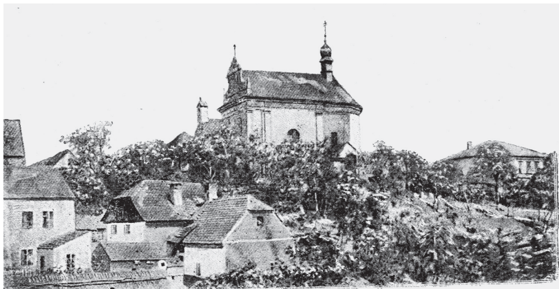
Tetín na fotografii z počátku 20. století

dobné rituální vraždy, stejně jako pálení mrtvého těla na hranici, zakazovalo – a Tunna a Gommon byli, stejně jako Ludmila, nepochybně věřící křesťané. Vždyť je podle legendy oslovovala „bratři“!