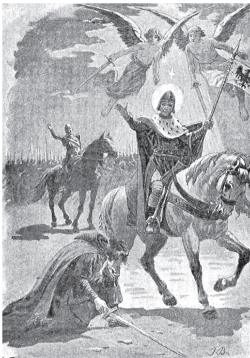
Kouřimský kníže se vzdává sv. Václavovi

tvrdili, že Václavova rotunda byla zbudována na místě, kde stávala socha čtyřhlavého slovanského boha Svantovíta. Svatý Vít měl nahradit podobně pojmenovaného boha, a posílit tak v ještě zpola pohanských Čechách křesťanství. Jenže pro podobné tvrzení nemáme jediný důkaz. Spíše bylo zasvěcení rotundy symbolem nového česko-saského spolenectví, svatý Vít byl totiž také patronem Sasů. Tato okolnost patrně vadila bojechtivým českým velmožům, kteří působili na Václavova mladšího bratra Bolesla-