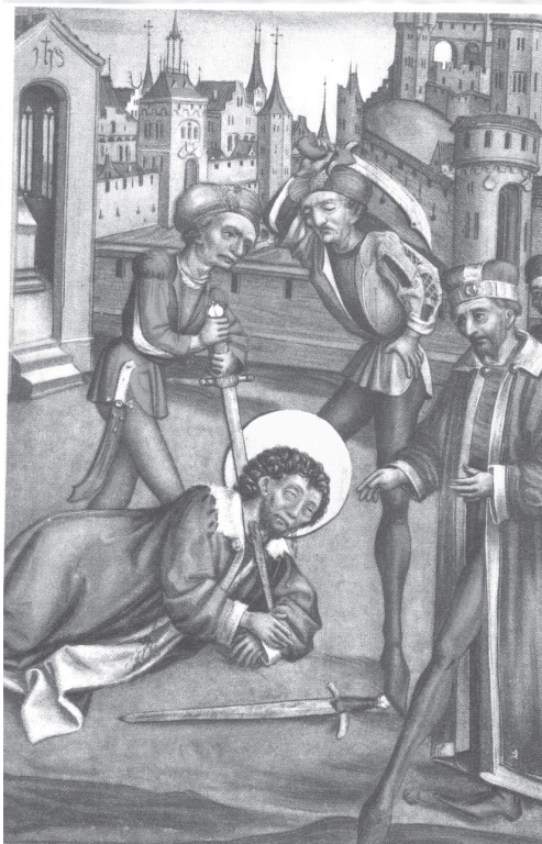
Smrt sv. Václava na vyobrazení z 15. století

dnes, ve Václavově případě nikdy nedošlo, ale úcta k jeho památce se rozšířila – což dokazuje vznik legend, sepsaných záhy po jeho zavraždění – velice rychle. Dá se říci, že jeho posmrtný život byl významnější než ten pozemský. Stal se zemským patronem a nebeským přímluvcem české země. A zůstal jím, navzdory peripetiím doby, až podnes, jak o tom svědčí opětovné vyhlášení dne jeho zavraždění státním svátkem.