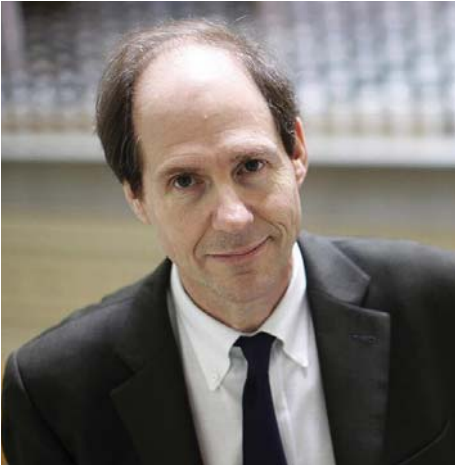
Cass Sunstein, pracovník Obamovej administratívy a odborník na konšpiračné teórie.

A odrazu tu máme novú konšpiráciu veľkú ako Jupiter. Dokonca konšpiráciu proti všetkým konšpiračným teóriám! Zároveň tu máme aj vysvetlenie, prečo sa niektoré skupinky tak vášnivo zaoberajú konšpiračnými teóriami.