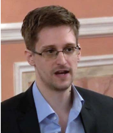
Bývalý pracovník CIA Edward Snowden, ktorý odhalil pred svetom praktiky odpočúvania.

Existujú aj úplne čerstvé prípady. Niektoré skupiny obyvateľov USA už dávnejšie tvrdili, že sú obeťami masívneho sledovania a odpočúvania, že Veľký brat známy z knihy Georgea Orwella naozaj existuje, a to priamo u nich, údajne v najľobodnejšej krajine sveta. Takéto úvahy sa pravidelne odmietali frázou „konšpiračné teórie“ a odporúčaním, aby sa ich autori dali vyšetriť. Trvalo to dovtedy, kým istý Edward Snowden nepredložil dôkazy, že sledovanie, ako ho realizujú Spojené štáty, je ešte hrozivejšie a že špicľovaniu sa nevyhli ani najbližší a najvernejší americkí spojenci za oceánom.