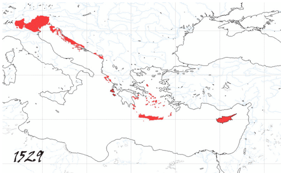
Mapa Benátského území v r. 1529

5. století – Venetové se utíkají do laguny před vpádem Gótů, Attila plní Veneto