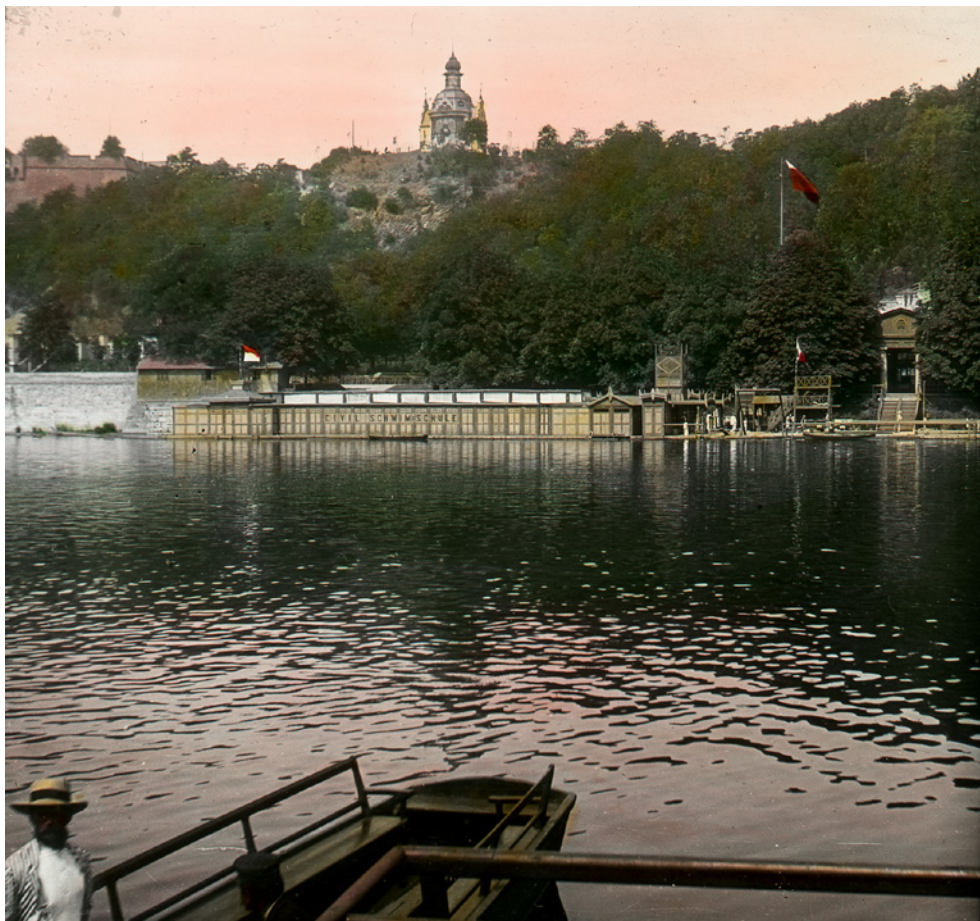
Občanská plovárna v roce 1903, tedy pouhé dva roky předtím, než málem padla za oběť potřebám rozrůstajícího se města. Od plánované výstavby nábřeží bylo nakonec upuštěno. Fotoarchiv ODTVS, PS-1016, foto Jaroslav Tkadlec, skleněný diapositiv

ženami těšilo relativní oblibě, byť musely až do dvacátých let 20. století nosit těžké a nepraktické plovací úbory.