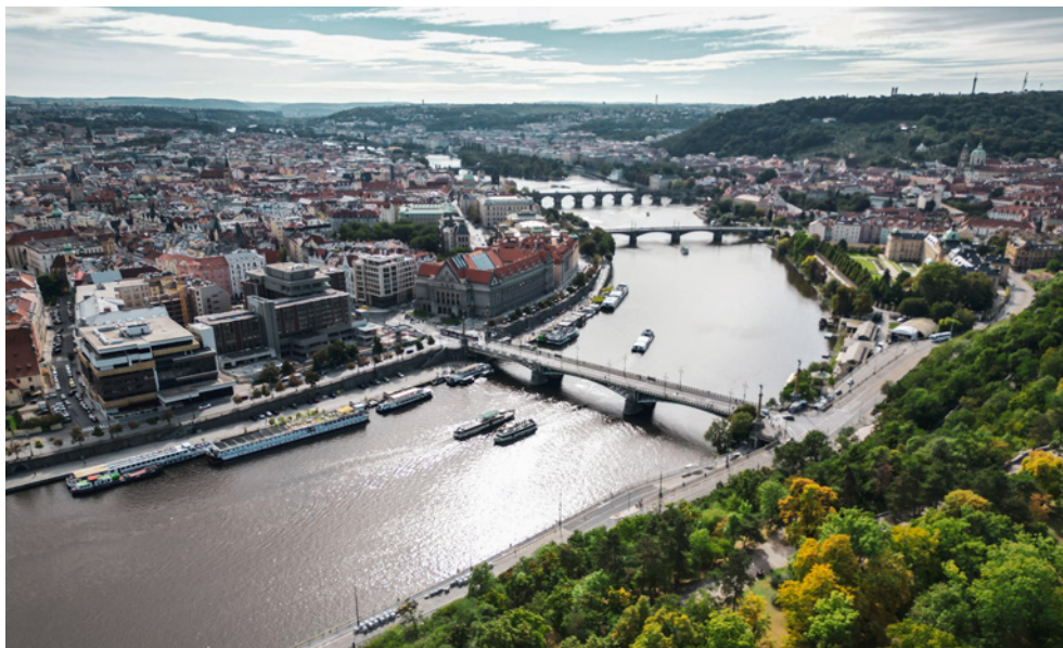
Snad nejznámější pražskou plovárnou byla Občanská (na pravé straně fotografie mezi Čechovým mostem a Strakovou akademií). Vystavěna byla v roce 1840 podle návrhu architekta Josefa Krannerera.

Rituální funkce lázní při klášterech a kostelech (např. balnea animarum , tedy zádušní koupele, případně očista mrtvých před pohřbem) po dlouhou dobu převažovala nad funkcí praktickou a osobní hygiena se čas od času stávala předmětem kritiky církve. 6 Vztah k očistě doznal výrazné proměny až na konci 18. a v průběhu 19. století. Vodě se začaly v této době připisovat léčivé účinky, s čímž souvisí rozvoj otužování, ale i balneologie. Za původce nemocí byli poprvé označeni mikrobi a hygiena začala být povolna vnímána jako způsob, jak onemocněním předcházet. 7