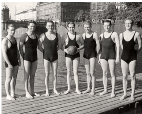
Zápasy ve vodním pólu na Vltavě v Praze, třicátá léta 20. století. Fotoarchiv ODTVS, H7F 058032 a H7F 058034, Press Photo Service

a před svým zenitem se honosila titulem největší plovárny ve střední Evropě. Vešlo se sem až 1200 lidí, kterým sloužila mola lemující takřka celý břeh.