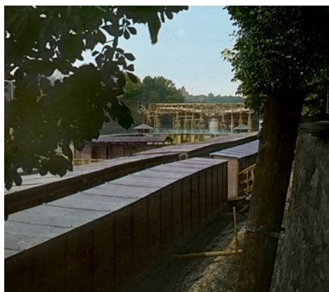
Plovárna Slovanka na Žofíně, asi kolem roku 1900. Fotoarchiv ODTVS, PS-0949 a PS-0950, foto Jaroslav Tkadlec, skleněné diapositivy

odolávaly řádění živlů. Často je odnesly povodně, s příchodem podzimu se musely rozkládat a zazimovat. Není divu, že se v Česku do současnosti nezachovala ani jediná z nich. Představu o jejich podobě si tak můžeme udělat pouze z dobových fotografií a vyprávění pamětníků.