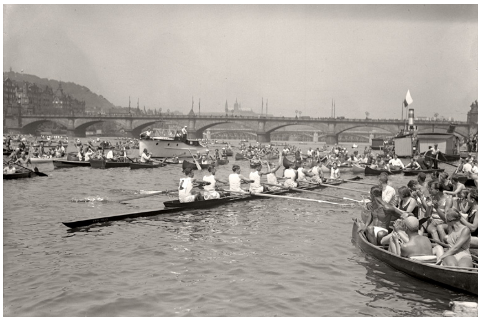
Vltava, konkrétně její pražský úsek, bývala pražským sportovním epicentrem. Situace se proměnila s rozvojem motorových lodí a především pak stavbou přehrad vltavské kaskády.