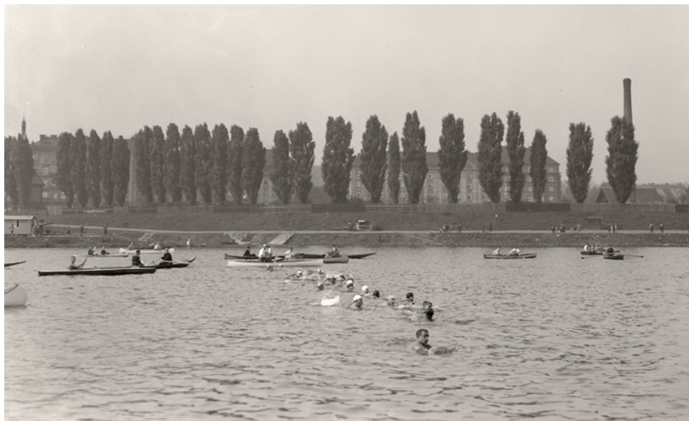
U Vyšehradské plovárny tradičně startoval závod Napříč Vltavou. Snímek z počátku třicátých let 20. století.

Další pontonové plovárny se nacházely u ostrova Štvanice, Libeňského ostrova, na Zlíchově, na Císařské louce, u smíchovského Hořejšího nábřeží, pod Braníkem, zkrátka u každého vhodného břehu či ostrova kromě úseku mezi Libeňským mostem a Podbabou, kde byla voda příliš znečištěná. Velmi oblíbeným úsekem se ukázalo být Podolí, kam se výrazně zlepšil přístup otevřením Vyšehradského tunelu v roce 1904. Zdejší přístav tak sloužil nejen k zazimování lodí, ale i dřevěných konstrukcí říčních plováren a lázní.