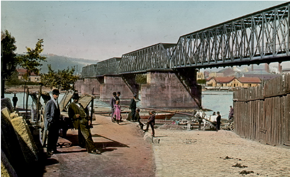
Před vybudováním náplavek ve druhé polovině 19. století byl přístup k řece značně omezený, jak vidíme na skleněném diapoziťu pořízeném před rokem 1901. PS-1472, skleněný diapoziť

kteřou do té doby vykonávala prakticky jen šlechta, se stala masová zábava. Bylo přirozené, že se před vznikem velkých sportovišť obracela pozornost Pražanů k řece, nabízející bohatou škálu pohybového využití.