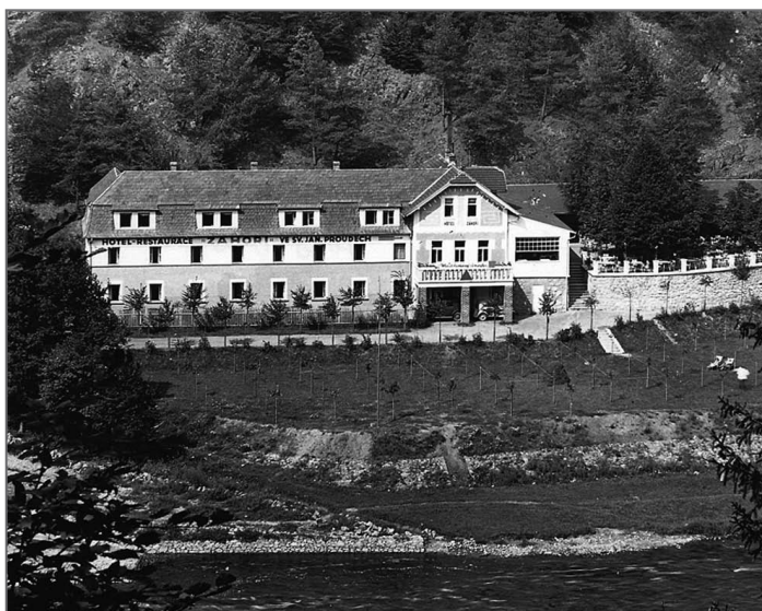
Hotel Záhoří na dobové pohlednici

Hotel je v provozu i teď během zimy, dokonce tu jsou ubytovaní hosté. Jeden je trochu divný, ale zdá se, že se o něj nikdo nezajímá. On si to nejspíš i myslí, jenže se krutě mylí.