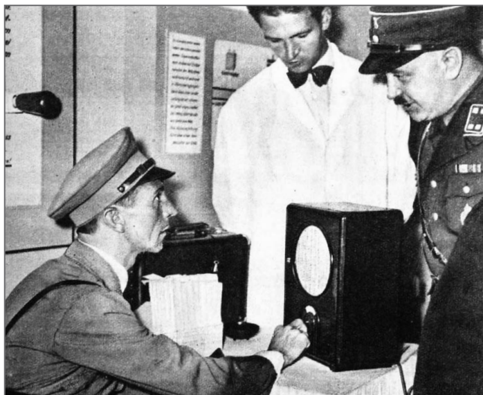
Joseph Goebbels (sedící) předvádí Volksempfänger, lidový radiopřijímač

Ale všichni Němci ještě nepodlehli. Proti všemocnému doktoru Goebbelsovi ovládajícímu mocenské nástroje totalitní Říše ještě stál prakticky osamělý chlapík ukrývající se v hotelu Záhoří. Inženýr Formis, jeden z nejlepších odborníků na bezdrátovou komunikaci, neměl Hitlera rád. A tehdy se stalo něco zvláštního: do proudu propagandy linoucího