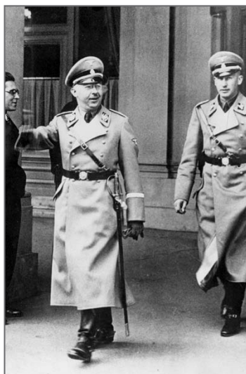
Protektorát Čechy a Morava ovládal černý řád SS. Na snímku Heinrich Himmler a Reinhard Heydrich