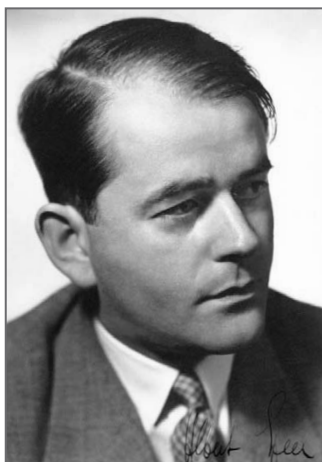
Ministr zbrojního průmyslu Albert Speer

a Slováci. Přitom podstatná část tohoto osudového dramatu se odehrála na našem území. A navzdory úsilí historiků v něm je pořád mnoho nejasného.