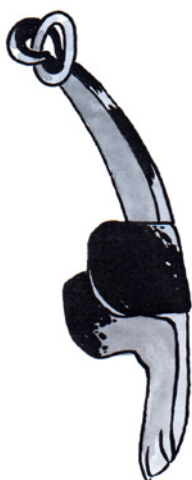
Takto vypadala čuba.

V druhé polovině 18. století docházelo ve formanském řemesle ke změnám, které se týkaly bezpečnosti jízdy, a to konkrétně povinného brzdění. Díky nařízení Marie Terezie byly před místa se sklonem větším než 15 stupňů rozmístěny na silnicích štíhlé hranolovité tzv. brzdné kameny (předchůdci dopravních značek). Jakmile forman dojel k brzdnému kameni, musel zastavit a nasadit jedno ze dvou tehdy existujících brzdných zařízení, která zajišťovala, aby vůz nenajel do koní a vážně je nezranil.