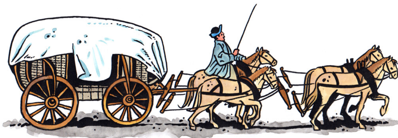
Formanský vůz s nákladem a forman na podsedním koni.

Formani cestou obvykle nesedali na voze, ale buď chodili vedle něj s bičem a opraťmi v rukou, nebo sedali na tzv. podsedního koně . Tím býval levý kůň ze zadního páru, jemuž se takto říkalo proto, že byl „pod sedlem“ neboli – dnešním jazykem řečeno – byl osedlán.