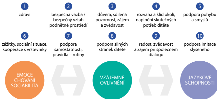
Obr. 1 Podmínky pro vývoj jazyka

OBOHACOVÁNÍ JAZYKOVÉHO PROSTŘEDÍ Až 20 % dětí má obtíže ve vývoji jazyka a řeči