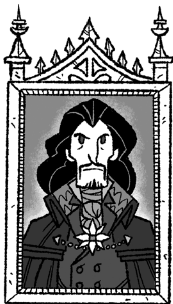
HRABĚ DRACULA tajemný rumunský šlechtic