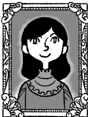
MINA MURRAYOVÁ Jonathanova snoubenka