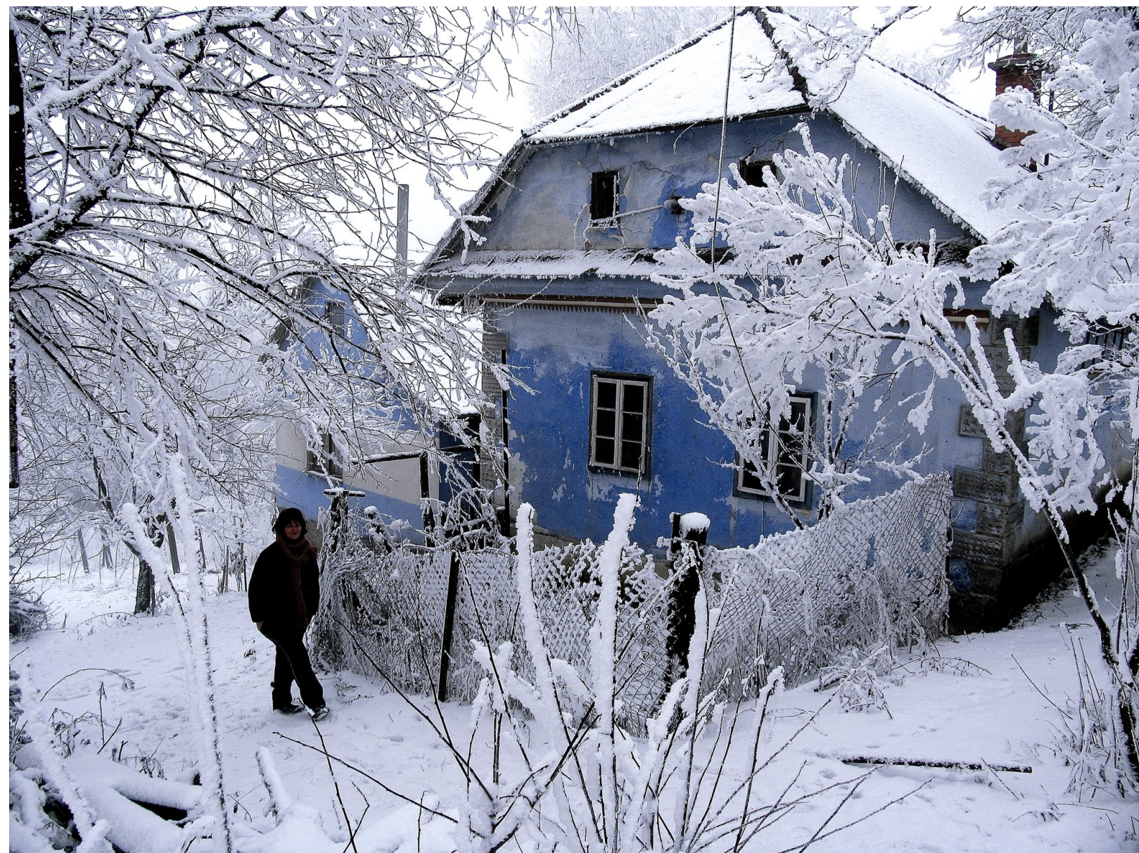
Babkin domček na kopaniciach