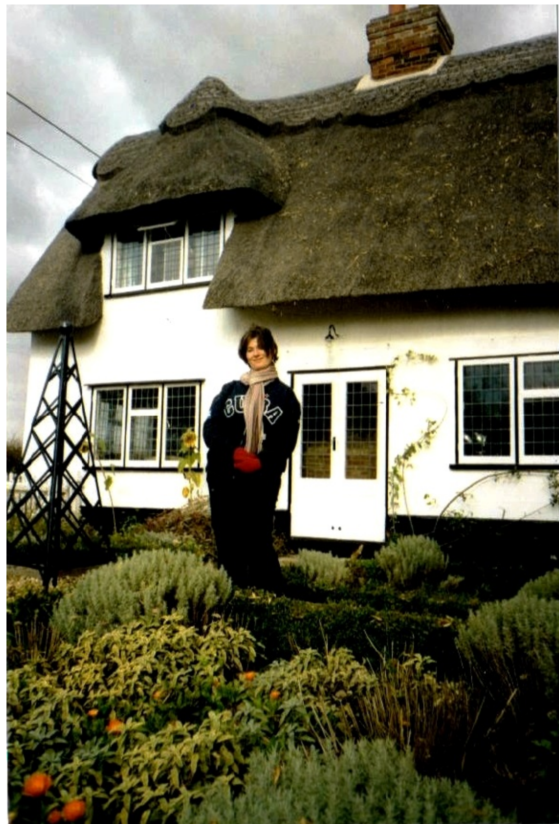
Odchod do mesta Luton