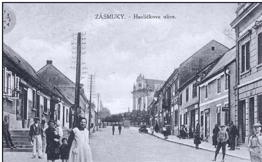
Zásmyky v době, kdy jsem tam chodila do měšťanky v letech 1921-1925.