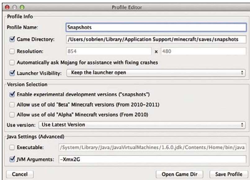
OBRÁZOK 1.2: Tvorba vlastného profilu

Sú pomenované podľa roku a týždňa, v ktorom vyšli, a na konci majú písmeno, ktoré ukazuje, koľký je to snapshot v jednom týždni. Napríklad I4w25b znamená, že je druhý v týždni 25 a roku 2014. Mimochodom, ak Enable experimental vypnete, rozbaľovací zoznam bude ukazovať len finálne verzie.