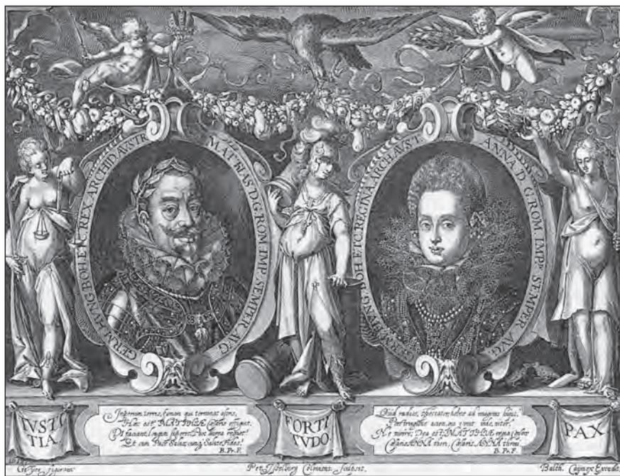
Císař Matyáš se svou manželkou Annou Tyrolskou

V roce 1604 protestanti ustoupili bez boje ve Štrasburku, kde se nacházela významná nekatolická akademie a kde pod tlakem okolností musel rezignovat na svůj biskupský úřad braniborský hohenzollernský markrabě Jan Jiří, pozdější krnovský kníže. Rekatalizace vyvolávala značné znepokojení falckého kabinetu, reprezentovaného Kristiánem starším z Anhaltu. Heidelberský kalvínský dvůr představoval neuralgický bod v habsburských plánech.