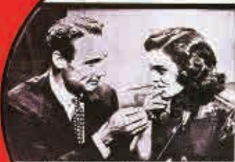
YOUTHFUL MARIHUANA VICTIMS