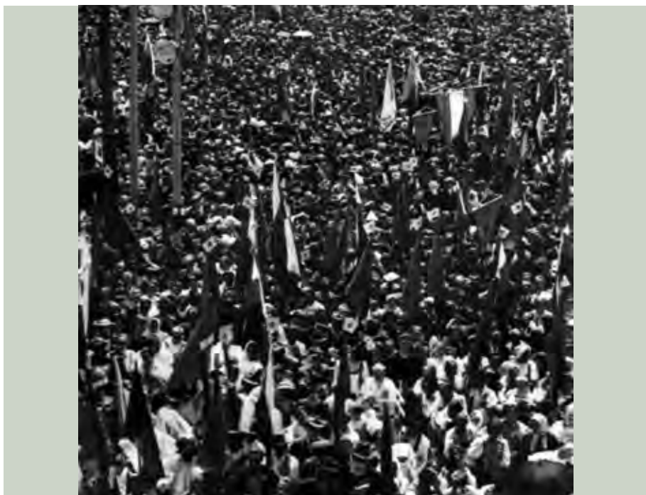
Manifestácia za autonómiu Slovenska v Bratislave 5. júna 1938

na hraniciach s ČSR, kde nespozorovali žiadne zvýšené vojenské aktivity. Dôveryhodnosť pražskej vlády v Londýne a Paríži prudko poklesla a nacistická propaganda mohla čs. prezidenta vykresliť pred celým svetom ako vojnového štváča.