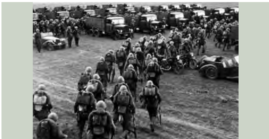
Mobilizované čs. jednotky sa presúvajú do pohraničia

Hitler sa medzitým intenzívne pripravoval na vojnu, ale čs. politici stále verili, že sa im podarí dosiahnuť v otázke Sudet kompromis. V pondelok 5. septembra 1938 zašla Hodžova vláda na samú hranicu možností a súhlasila s požiadavkami Karlovarského programu . Sudetskí Nemci tak v priebehu necelých piatich mesiacov získali vďaka nátlaku a vydieraniu úplnú autonómiu, o ktorú Slováci demokratickým a nenásilným spôsobom márne zápasili dve desaťročia. Pochopiteľne, pre predstaviteľov HSLS to bol obrovský šok. Dňa 11. septembra 1938 zverejnil stranický denník Slovák článok Karola Sidora s príznačným názvom „I naša trpezlivosť je na konci!“, v ktorom uviedol: „Prichádza práve čas na uspokojenie požiadaviek i vyhovenie sťažnostiam všetkých národností žijúcich v republike... Nesmieme byť obídení ani my, naopak, my sme mali byť prví! Ak sa veľký národný spor Slovákov s Čechmi nezlikviduje dnes, už k tomu nedôjde. Ak sa slovenský problém nevyrieši teraz, nebude riešený nikdy viac!“