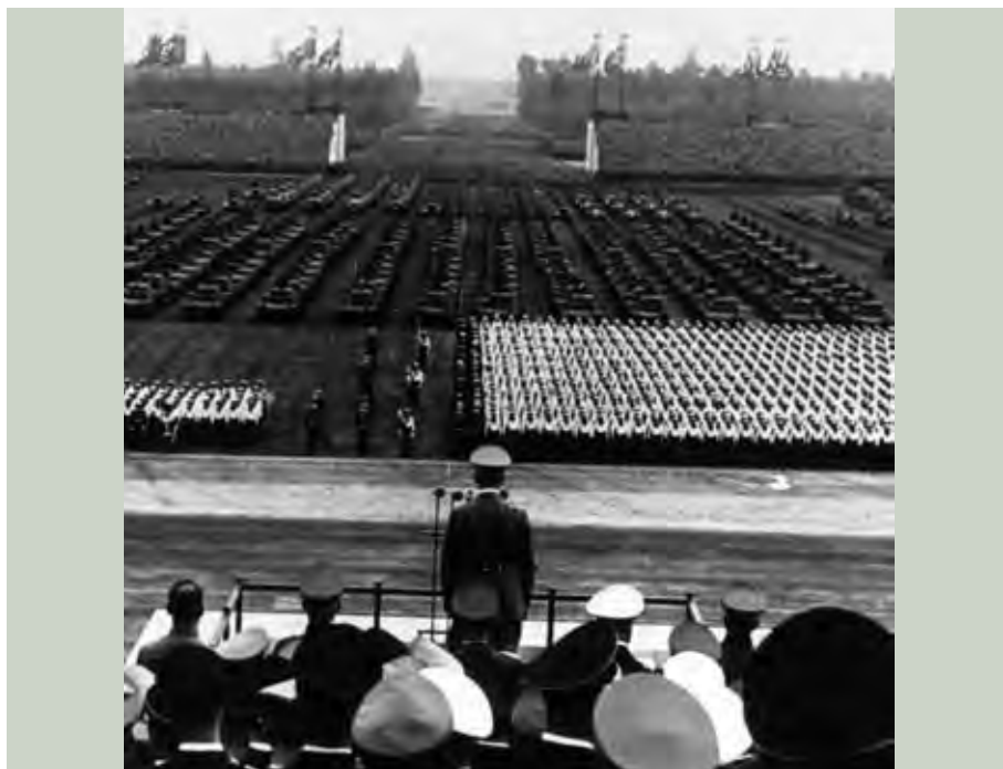
Hitlerov prejav na X. zjazde NDSP v Norimbergu 12. septembra 1938

biscitu. Runciman mu následne položil otázku, či by túto záležitosť nemohla vyriešiť medzinárodná konferencia. Henlein súhlasil, a tým sa stala dohoda medzi pražskou vládou a SdP bezpredmetná.