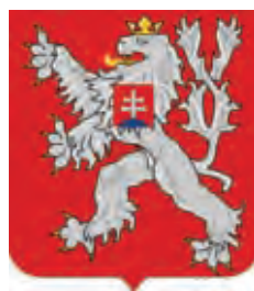
Malý štátny znak ČSR