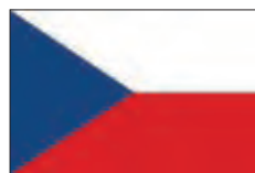
Štátna vlajka ČSR

Vysokú nezamestnanosť na Slovensku zhoršovala i skutočnosť, že pracovné miesta v štátnom aparáte a vo verejnej službe dostávali prednostne Česi, a to aj v prípade, keď bol dostatok kvalifikovaných domácich uchádzačov. Obzvlášť kriklavo sa národnostná diskriminácia prejavovala v ozbrojených silách. Na začiatku roka 1938 tvorili Slováci 14 % príslušníkov čs. armády, no v jej dôstojníckom zbore mali len štvorpercentné zastúpenie. Medzi 139 čs. generálmi bol jeden jediný Slovák, Rudolf Viest. Rovnako neutešený stav vykazovalo Ministerstvo národnej obrany (MNO), kde pracovalo len deväť Slovákov. Stále väčšiu nespokojnosť vyvolával na Slovensku aj centralistický model ČSR a fikcia jednotného československého národa, ktorú až na malé výnimky presadzovala celá česká politická reprezentácia. Vďaka tomu silnelo na Slovensku autonomistické hnutie. Na jeho čele stála Hlinkova slovenská ľudová strana (HSLŠ) pod vedením ružomerského rímsko-katolíckeho farára Mons. Andreja Hlinku. Okrem nej sa za autonómiu zasadzovala len malá Slovenská národná