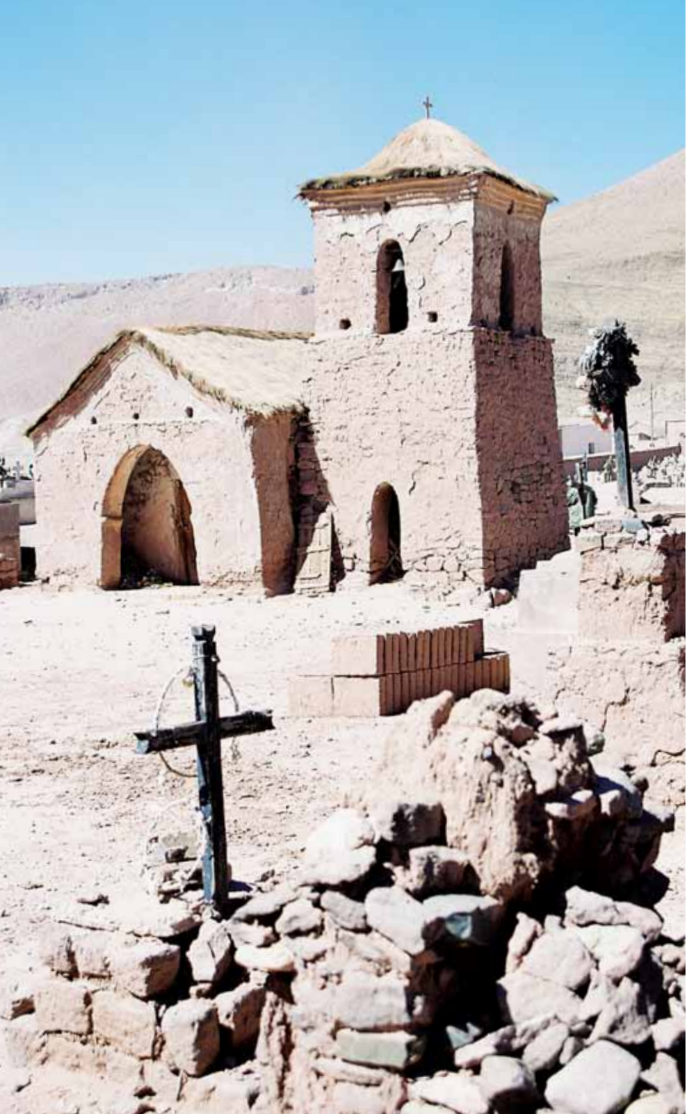
~ Priesmyk Jama (4 200 m n. m.), Čile ~