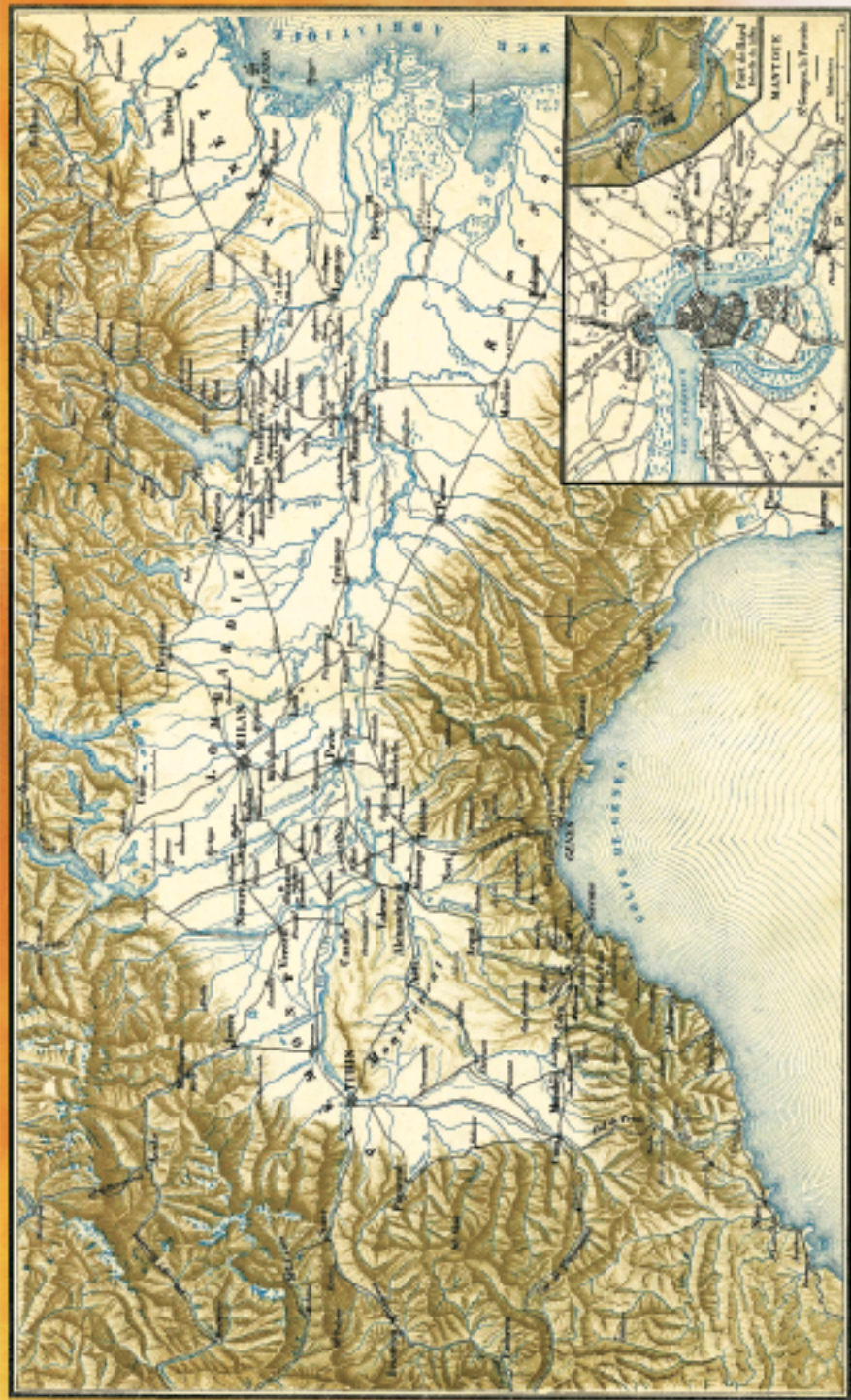
ITALSKÉ VÁLČIŠTĚ 1796 - 1800