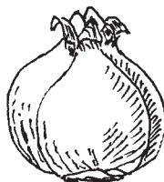
„Cibulohlíza“ Crocus × hybr.

Cibulovité hlízy mají rody jako např. Crocus nebo Gladiolus . Jejich zásobní orgán není diferencován jako u cibulovin (podpučí s pupeny a suknicemi), ale je více členěn než u pravých hlíz, které má třeba sasanka nebo jiřina. Tvarem se však cibulohlízy velmi podobají cibulím a vytváří také „brut“ – dceřiné hlízky (korálky).