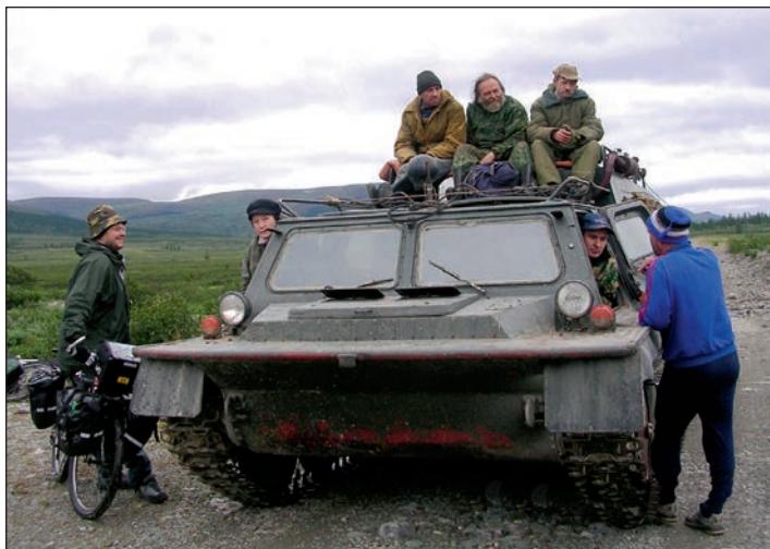
Vězděchod (Na kole z Archangelska přes Polární Ural)