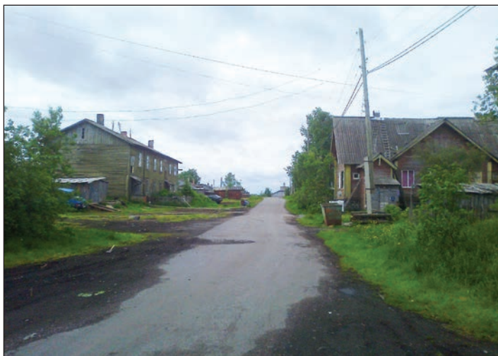
Rabočeostrovsk (Solovky na kajaku)