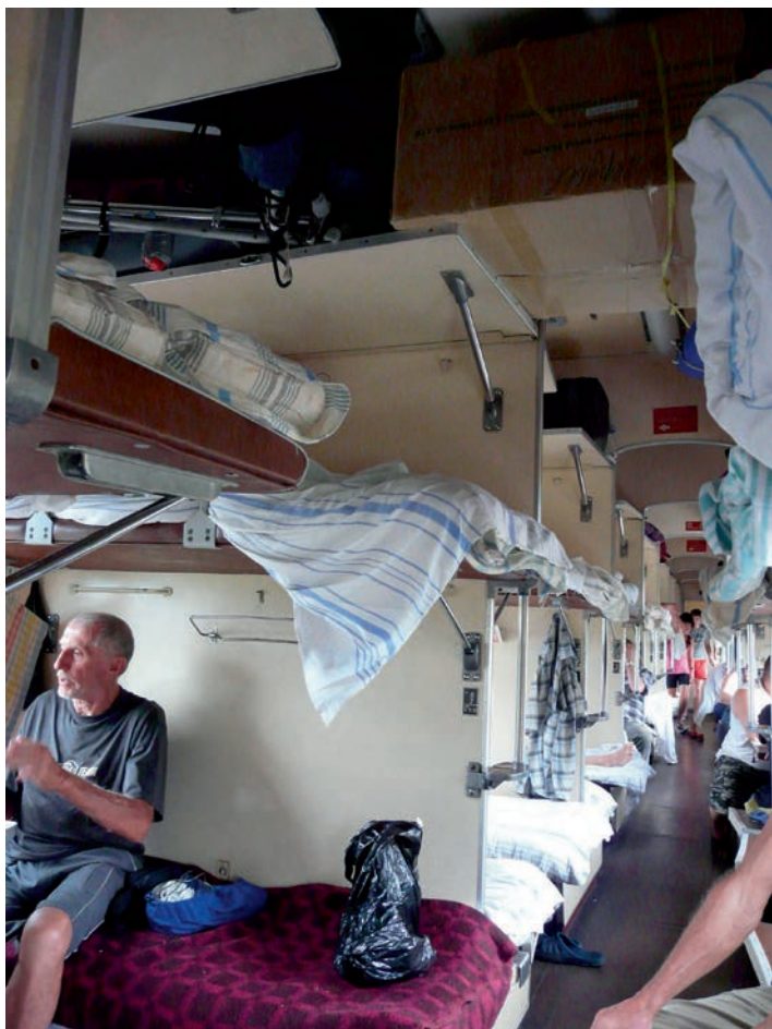
Spací vagon pro 57 osob (Člunem po Pečeře)