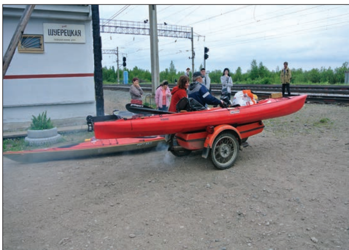
Na kajaku jinak (Solovky na kajaku)