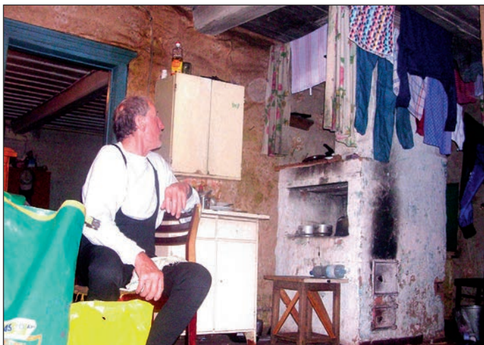
Za peči je tepleji (Na kole z Archangelska přes Polární Ural)