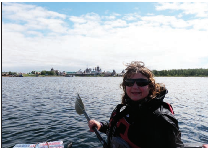
Monastyr (Solovky na kajaku)