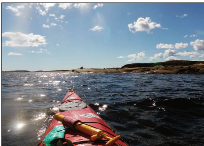
Studený třpyt (Solovky na kajaku)