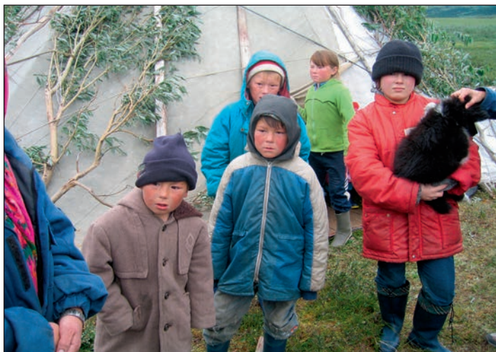
Prázdniny (Na kole z Archangelska přes Polární Ural)