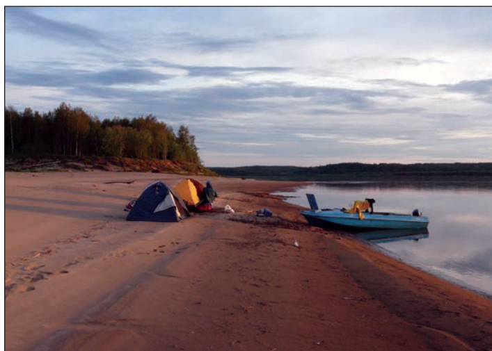
Spící Pečora (Člunem po Pečchoře)