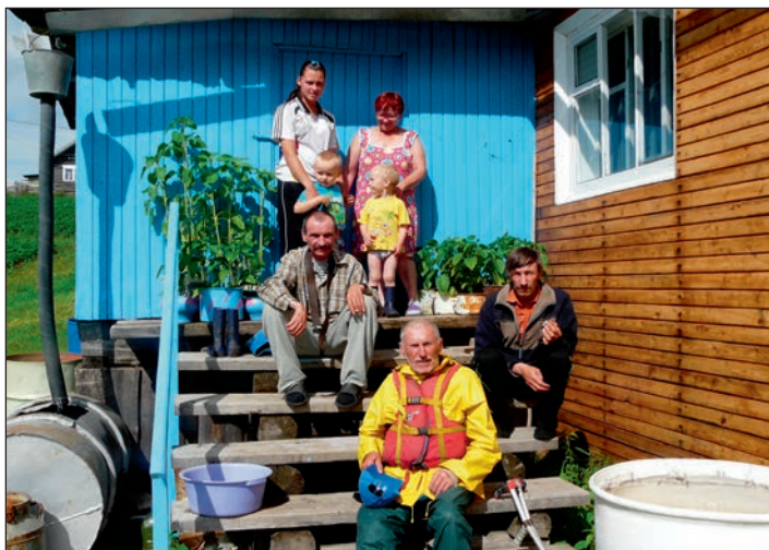
Rodina Komi (Člunem po Pečoře)