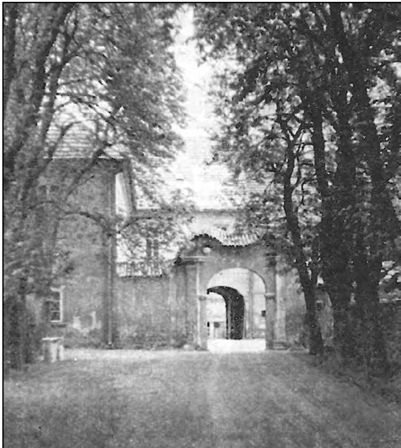
Vchod do zámku v Králově Dvoře