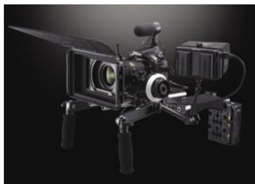
Digitální zrcadlovka s profesionálním příslušenstvím pro natáčení videa (Nikon D810)

lovek, které už také disponují rozlišením 24, 36 a 50 Mpx. Jde přeci jenom o levnější, univerzálnější, praktičtější, pohodlnější a také levnější řešení. Navíc je pravděpodobné, že rozlišení zrcadlovek do budoucna ještě poroste.