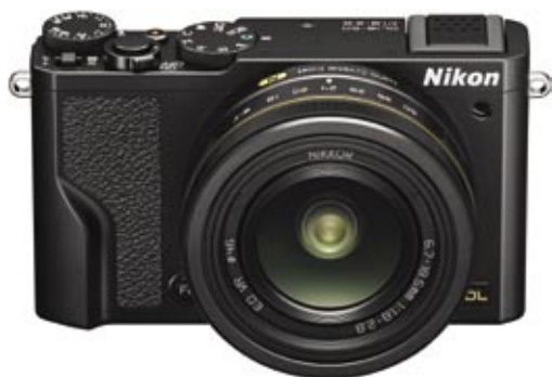
Kompaktní digitální fotoaparát bez výměnného objektivu (Nikon DL 18-50)

Základní kategorií digitálních fotoaparátů jsou tzv. kompakty. Dnes už do této kategorie patří i mobilní telefony a tablety s integrovaným fotoaparátem. Jde tedy převážně o kapesní přístroje s malým snímačem a možnostmi nastavení expozice.