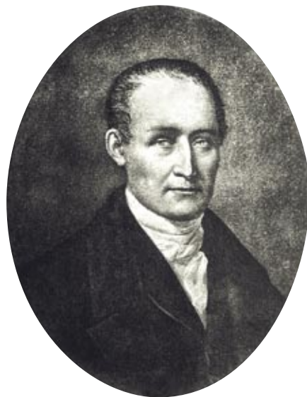
Joseph Nicéphore Niépce (1765–1833), jeden z průkopníků vynálezu fotografie

otvorem světlo prochází, tím ostřejší je promítaný obraz. Později se do otvoru umístila čočka, a tak byl vlastně na světě první fotoaparát. Tedy ne v pravém slova smyslu, vlastně šlo spíše o jakousi živou promítačku, která sice přenesla obraz, ale neuměla ho nijak uchovat. To ale v hojně míře začali využívat malíři, kteří promítanou scénu překreslovali, a tak vznikaly první foto-realistické obrazy.