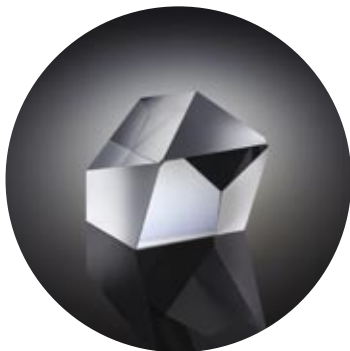
Oko zrcadlovky - Pentaprismatický hranol (Nikon D500)

A jak tedy funguje zrcadlovka? Princip je v podstatě velmi jednoduchý. Objektivem, skrze