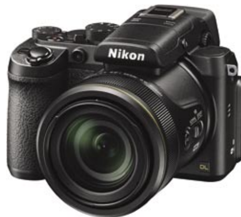
Kompaktní digitální fotoaparát bez výměnného objektivu – ultrazoom (Nikon DL 24-500)

Dnes navíc lze mezi kompakty najít přístroje velikostně srovnatelné se zrcadlovkou, které mají plně manuální nastavení expozičních hodnot, nebo dokonce stejně velký snímač. I obrazová kvalita je tedy srovnatelná. Jediné, čím se odlišují, je napevno zabudovaný objektiv, který na rozdíl od zrcadlovky nelze vyměnit.