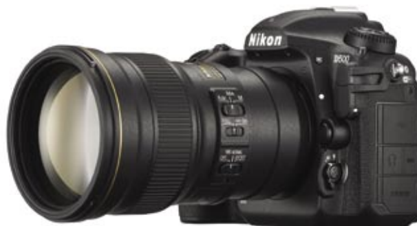
Digitální zrcadlovka vyšší třídy DX (Nikon D500)

Tyto fotoaparáty slouží především jako obrazové záznamníky a tomu odpovídá i technická kvalita fotografií. Rozhodně nejsou určeny k profesionální nebo nějaké kreativní tvorbě. Na druhou stranu, pro běžné rodinné fotografování a dokumentární účely stačí.