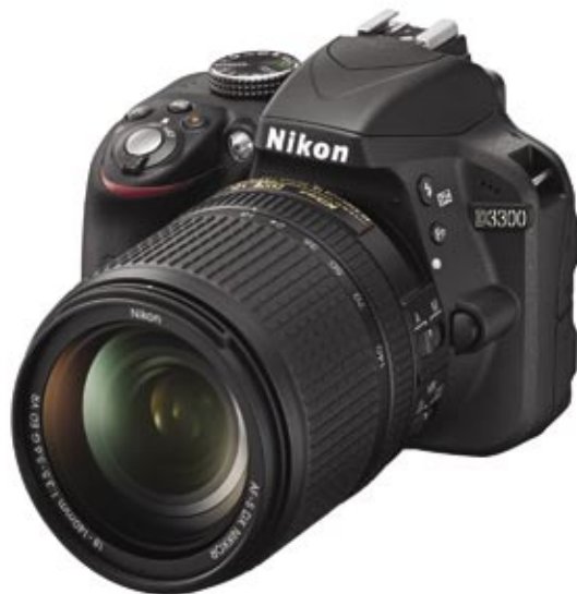
Digitální zrcadlovka nižší třídy DX (Nikon D3300)

clonový mechanismus, projde světlo do těla přístroje a zde narazí na šikmé zrcátko. To odrazí světlo na optický hranol nebo další soustavu zrcátek a odtud je obraz přenesen do hledáčku. Díky tomu vidíte skrz objektiv to, co fotografujete, i když je hledáček výš než samotný objektiv. Světlo tedy jednoduše projde objektivem a fotoaparátem až k oku. V této fázi ale nemůže dojít k záznamu obrazu. Proto se po stisknutí spouště zrcátko sklopí směrem nahoru, přestane přenášet obraz do hledáčku k oku, ale propustí ho dále po své ose. Tam narazí na další překážku, a tou je závěrka. Jde v podstatě o jakási „dvířka“, která se během expozice otevrou na určitý čas a pustí světlo na film, dnes snímač nebo jiný světlocitlivý materiál.