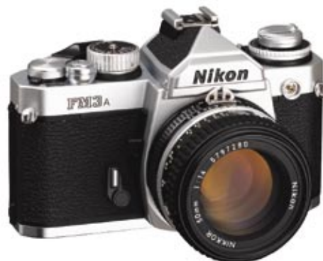
Kinofilmová zrcadlovka (Nikon FM3A)