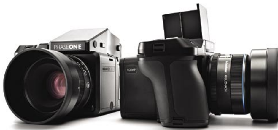
Digitální fotoaparát středního formátu s rozlišením 100 Mpx (Phase One XF 100MP)