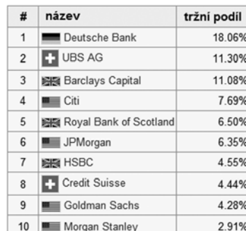
Tabulka 1.1 10 největších forexových obchodníků