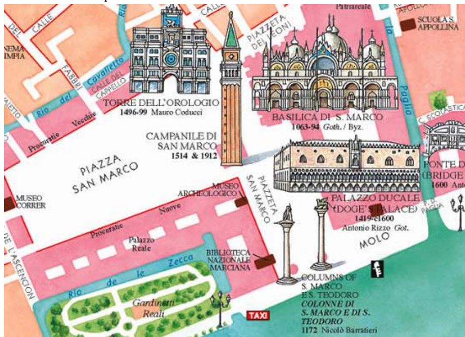
Obrázek: Mapka nám. sv. Marka a okolních budov.

Druhá část náměstí je tzv. Piazzeta di san Marco , které ústí k nábřeží a na molo sv. Marka, kde se nacházejí dva velké sloupy – jeden se sochou sv. Teodora a druhý s okřídleným lvem, symbolem sv. Marka. Piazzeta je lemovaná na jedné straně Dóžecím palácem a na druhé straně starou knihovnou – Biblioteca Sansoviniana nebo také Biblioteca Nazionale Marciana (dle architektů, kteří je postavili). Na konci Biblioteky se nachází Campanilla – zvonice sv. Marka, ze které je nádherný výhled na město.