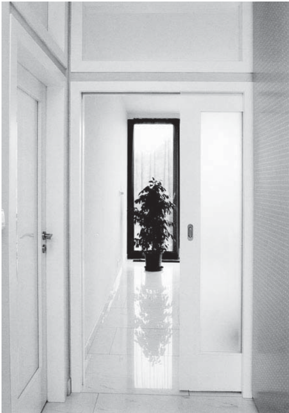
▲ Posuvné dveře zajištěné do stěny nepřekážejí. Izolují teplo, hluk i pachy.

Posuvné dveře jsou vhodným řešením do malých bytů, neboť jejich křídla si vzájemně nepřekážejí a nebrání v komunikaci. Aby posuvné dveře dokonale těsnily, je potřeba zazdítk do stěny ocelové pouzdro, do něhož se později zavěsí a v němž pojíždějí. Ideální doba pro zazdění pouzdra je tehdy, když se vyměňuje umakartové jádro v panelovém bytě, a všude tam, kde se stavějí nové příčky. Posuvné dveře vně stěny nezajistí dokonalé těsnění a nelze je použít do koupelny a na WC. Výhodou tohoto systému však je, že nevyžaduje speciální stavební úpravy. Instalace se provádí dodatečně po rekonstrukci. Pojíždějící kování –