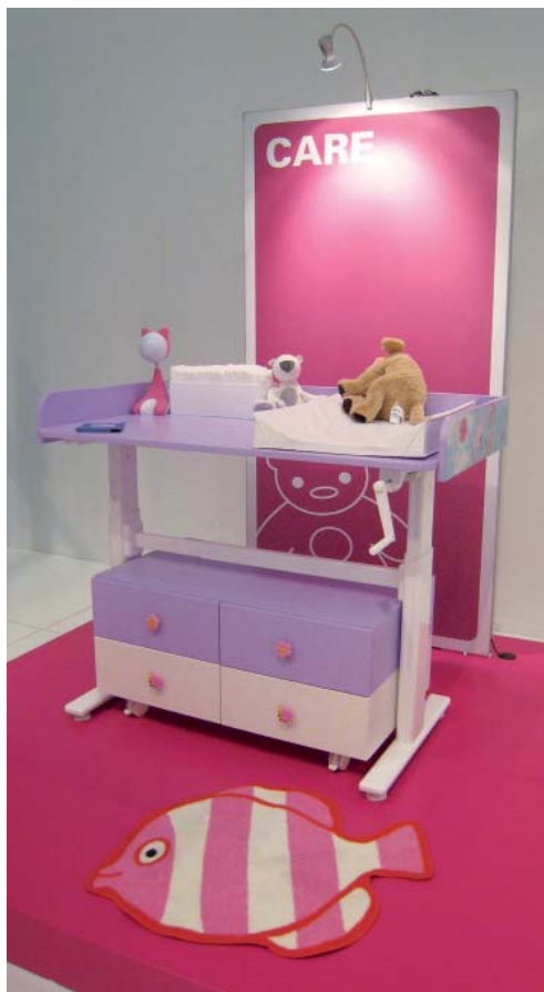
Ergonomie v praxi: přebalovací pult s výškovou regulací se přizpůsobí tělesným rozměrům obsluhující osoby

otupuje smysly a v noci může být příčinou nespavosti. Kromě hluku způsobeného nekvalitním nábytkem může rušit i hlučné venkovní prostředí. Lze očekávat, že se nebezpečí hluku v interiéru v budoucnu bude věnovat stále větší pozornost a designéři by měli vzít tento aspekt v úvahu už při koncepci nových předmětů.