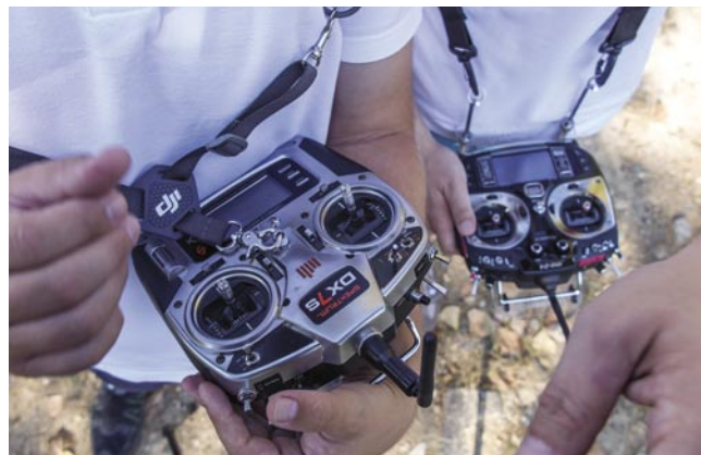
Pokud dron obsluhují dva lidé (pilot a operátor), jeden má na vysíláči zpravidla povely pro samotný dron, druhý pro kameru. [AC]