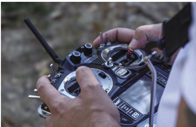
V případě jednomužného ovládání jsou na vysíláči ovládány nejen povely pro ovládání dronu, ale též kamery a jejího náklonu. [AC]