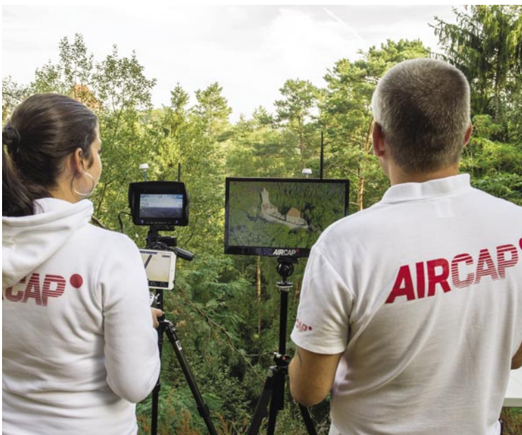
Přenos obrazu nepotřebuje pro svou práci jen operátor kamery, ale rovněž i pilot dronu. V některých situacích mu totiž živý obraz může pomoci se správnou orientací dronu, případně zjednoduší komunikaci mezi oběma členy týmu. [PJ]

skladování se doporučuje baterie vybit na přibližně \frac{1}{3} jejich kapacity (3,8 V na článek), nabíječky často nabízejí mód Storage. Nejnovější kvadrokoptéry Phantom již používají inteligentní baterie, které si vybíjení na skladovací napětí hlídají sami.