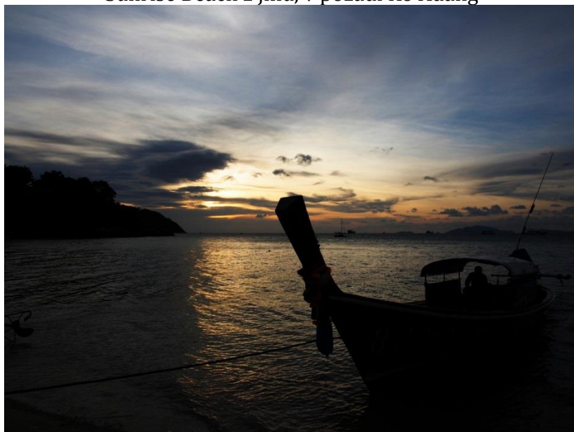
Západ slunce na Sunset Beach