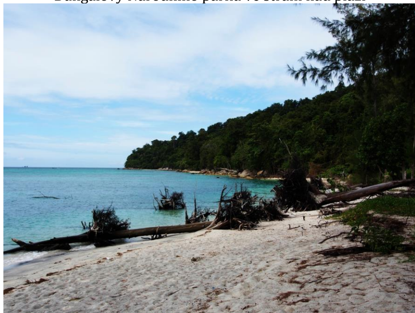
Pohled směrem na západ z jižní pláže.