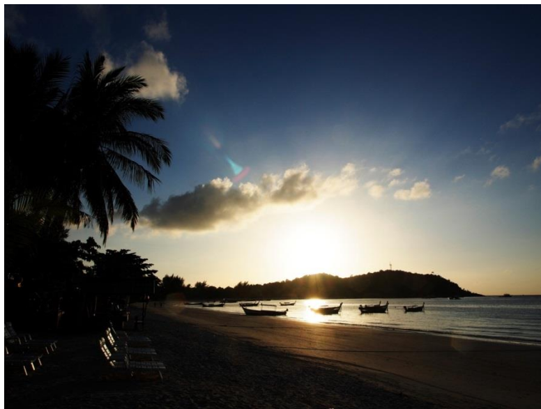
Východ slunce na Pattaya Beach