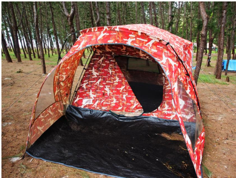
Stany Národního parku jsou levné a prostorné