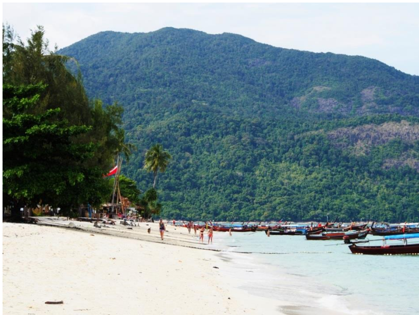
Sunrise Beach z jihu, v pozadí Ko Adang