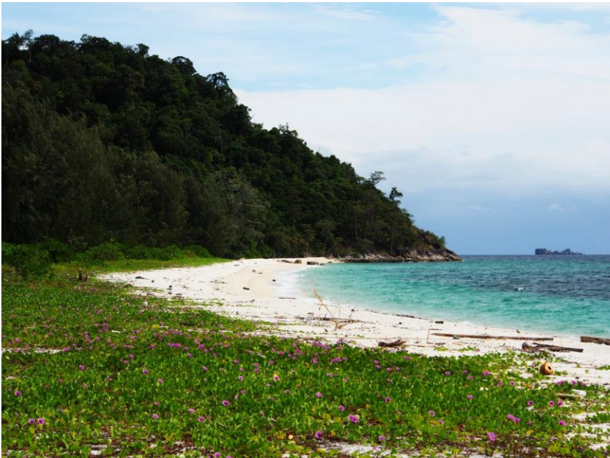
Pláž na sever od staveb Národního parku

Jak se na ostrov dostat: Long-tail boat (tradiční dřevěná loď) z Ko Lipe je na Ko Adangu za cca 30 minut.