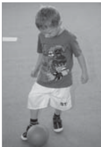
Vedení míče vnitřní stranou nohy