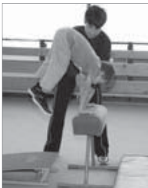
Dopomoc při naskoku na kozu

V pozici vedle kozy (švédské bedny) uchopíme dítě jednou rukou za paži a druhou rukou nad zápěstím.