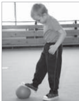
Zastavení míče nohou

Podsazená pánev, správná poloha trupu, ramena stažená směrem dolů k pánvi, hlava vytažená v prodloužení páteře, kolena o něco níže než kyčle, osy kolen směřují k palcům na noze (klouby dolních končetin v jedné ose – kyčel, koleno, palec), celá chodidla na zemi.