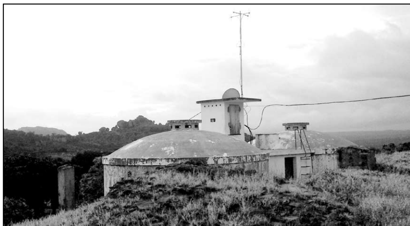
▲ Pevnostní vodojem v Quibale

Na prostranství i v místech, kam jsem se nedostal, lezli krásní hlemýžďi se šroubovitě protáhlou ulitou. A se svou ulitou ve tvaru kornoutu na zmrzlinu lezli pomalu a já je fotografoval, ale z neznámého důvodu jsem fotografie nenašel. Ale přelud to nebyl, kolegové je viděli taky.