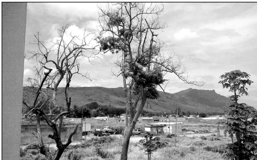
▲ Výhled z našeho hotelu ve Waco Kungo

Ráno jsme hned po hotelové snídani vyrazili do centra na náměstí k sídlu guvernéra, kde jsme chtěli domluvit návštěvu podnikatelů z avizované delegace jihomoravského kraje a současně nabídnout pomoc při řešení celé výstavby vodovodní soustavy i s nabídkou na mezioborovou spolupráci mezi městy Brnem a Waco Kungem. Našel jsem v parku před jeho úřadem vzorně sestřižené trávníky, řezem