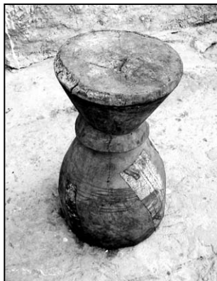
▲ Starý buben z Luandy

V noci není takové horko jako minulý rok, protože jsem tu vymyslel systém větrání: přirozený průvan přes dveře „oficíny“, skrz obývák i chodbu až do otevřených dveří pokoje,