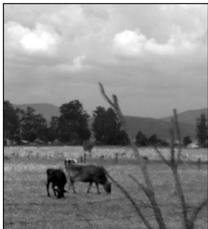
▲ Pokojné pastviny skotu u Waco Kunga

Projeli jsme kolem štavnatých luk s pasoucím se dobytkem a v dálce s pěkným namodralým hřbetem obrovského monolitu, který se mi líbil už minulý rok. Jak jedeme dál, hřbet se mění ve stěnu. Ale jakou, skvělou horolezeckou stěnu! A dole pod ní mi vedle silnice ubíhá plochá pastvina, někdy trochu lesostep, na ní vidíme různá plemena krav.