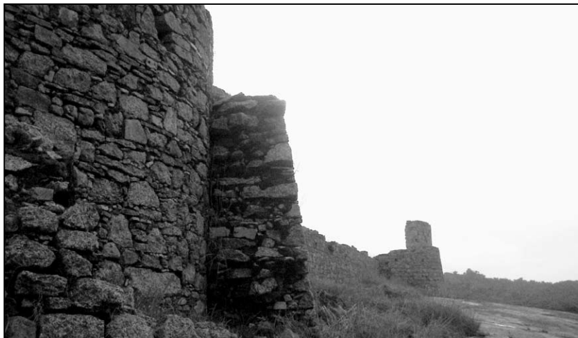
▲ Temné hradby pevnosti v Quibale

Říkám si – konečně jsem tu, i když skoro jsem to zase nestihl – vždyť už jednou mi pevnost kvůli soumraku unikla a já ji tolik toužil prozkoumat. Sedí si tu na temné skále, zdálky viditelná, a je z ní moc pěkný přehled po celém okolí a jistě se odtud dobře strážila tahle dopravní křižovatka.