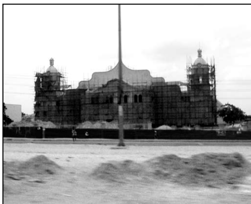
▲ Bleskové foto čela katedrály v Luandě

Vlevo je zajímavá stavba, můj oblíbený červeno-bílo-šedo-černý stadion, no a pak dál kolem areálu CHINA JIANGSU míříme do Viany se supernovými domy obklopujícími už skoro hotovou baziliku – a objekty této církevní stavby jsou tak obrovské, že mají být největší v této části Afriky. Čelo této – vzadu přísně funkční – stavby je pojato ve stylu staré katolické katedrály, s mohutným štítovým portálem se dvěma věžemi v čele. Vzadu pak s malou strážní věžičkou.