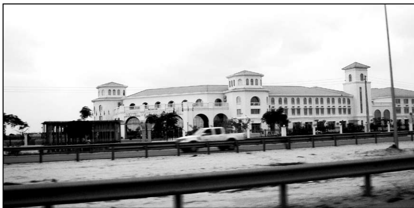
▲ Snímek luandského hotelového komplexu z auta

Putujeme opět na jih a mám pocit, že už jde konečně všechno hladce. Což se o přípravách na cestu do Angoly nedá moc tvrdit. Nejenže mi už doma nevyřídili povolení ke sběru brouků a odjížděl jsem s příslibem, že vše se zvládne až na místě,