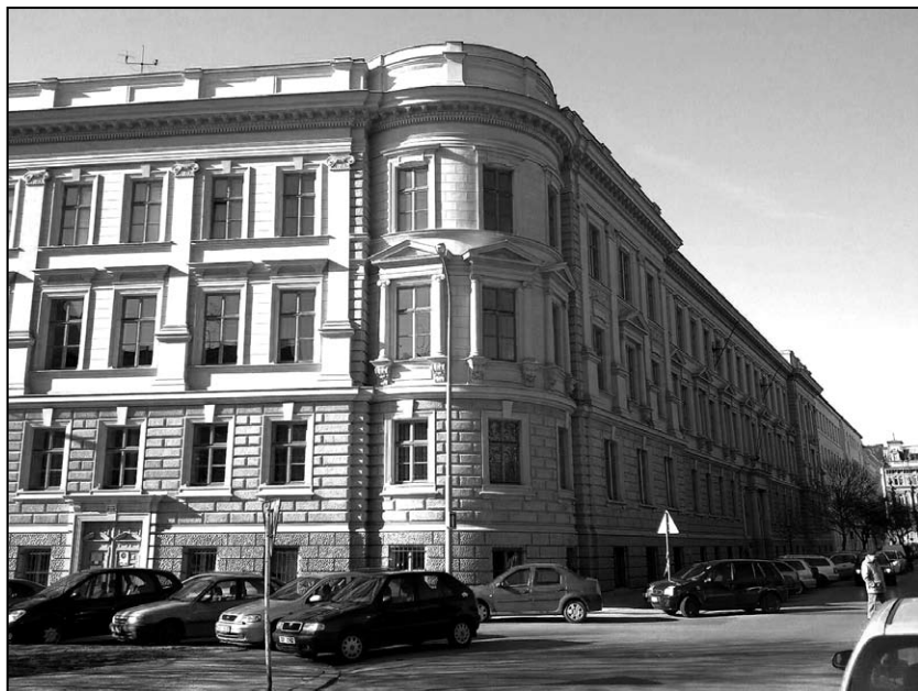
▲ Tak tohle je ta brněnská střední stavební průmyslová škola, která čeká na angolské studenty

Zde mohou angolské děti vystudovat češtinu a získat vzdělání v oborech dopravní stavby se zaměřením na pozici „technický dozor investora“, a to zejména pro komunikace, železnice a podzemní stavby. Také zde mohou vystudovat obor vodohospodářské stavby.