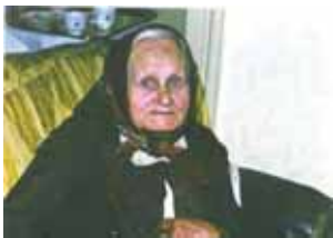
Stařa, babička „hůlková“

Narodil jsem se 13 dubna 1938 v Prostějově. Ne v nemocnici, jak je dnes zcela běžné, ale doma. Vždy jsem si myslel, že se tak