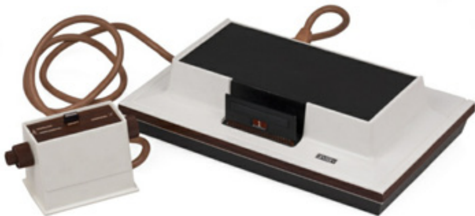
PRVNÍ VIDEOHRY. Magnavox Odyssey.

Ale byť honění čtverečků a teček vypadalo u dospělých lidí nepatřičně, investoři vycítili jistý potenciál a chtěli s Brown Boxem na trh. Mezi firmami Sylvania, GE, RCA, Philco či Sears nakonec zvítězil Magnavox, americký producent elektroniky, který Brown Box přepracoval a v roce 1972 vydal pod názvem Magnavox Odyssey . Díky reklamě s Frankem Sinatrou se během jednoho roku prodalo sto tisíc premiérových konzolí. Poprvé se hrálo doma. Co na tom, že zatím jen černobíle a bez zvuku.