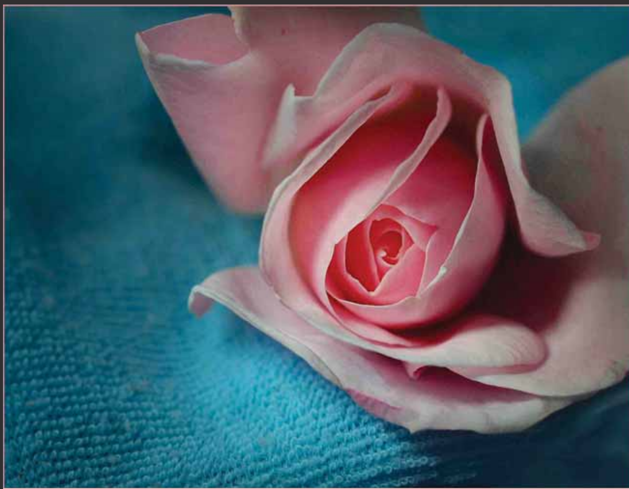
Teplá růžová vystupuje do popředí, chladná modrá do pozadí. Dvoubarevný snímek, vytvořený přímo expozicí.