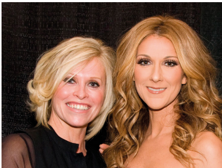
Se zpěvačkou Céline Dion

těžká, způsobovala jí otlačeniny na hlavě a mým úkolem bylo jejich zamaskování. Celou svatbu jsem si natáčela. Céline mě požádala, abych video nikde neukazovala, to bylo vše. Dodnes video zhlédla jen má rodina a je uloženo v rodinném sejf. Milovala jsem práci s Céline. Je velmi přirozená a milá a hodně se podobá svému otci, kterého jsem měla tu čest také poznat.