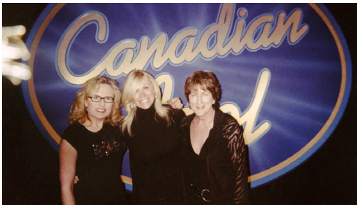
Při práci pro kanadskou televizi

jsem jen matně tušila, kde se nachází. Když jsem dorazila, spatřila jsem Marii Shriver s kadeřníkem, který jí chtěl natáčet vlasy na natáčky. A ona, že nic takového nechce (její vlasy nikdy natáčky neviděly). S hrůzou se na mě podívala a já jí slíbila, že jí po nalíčení upravím vlasy bez natáček. Tak začal můj první den natáčení. S Marií jsem se setkala ještě několikrát, hlavně na olympijských hrách, a ona si mě vždy pamatovala jako svou „zachránkyni“, jak mě později nazvala na jedné párty.