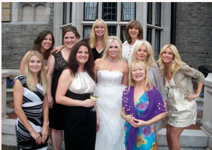
Nevěsta s kamarádkami