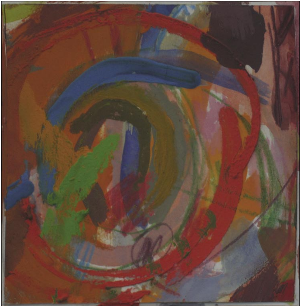
Drahomíra Lányí, Ruah, kombinovaná technika, 10x10 cm, 1992