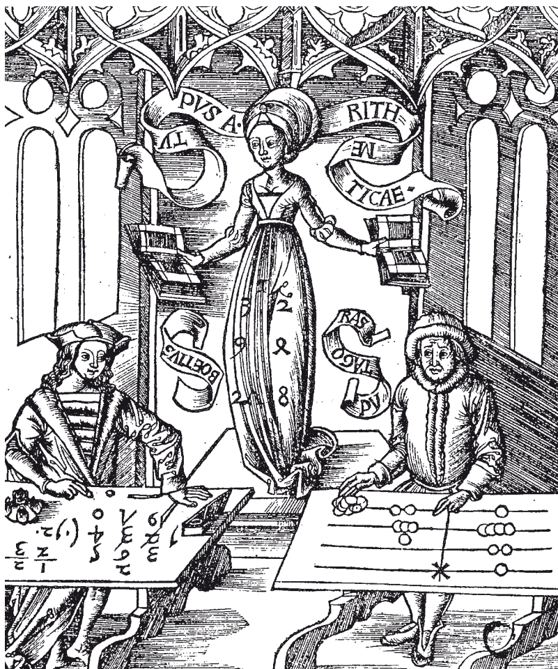
Tato rytina Gregora Reische ze 16. století zachycuje Pythagora, jak užívá středověkého deskového počítadla k vytváření čísel 1, 241 a 82 (vpravo). Vlevo počítá Boethius s využitím arabských číslíc, jaké známe dnes. Uprostřed stojí Aritmetika, která má na svých šatech dvě geometrické posloupnosti: 1, 2, 4, 8 a 1, 3, 9, 27.