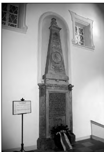
Paracelsův náhrobek v Salcburku.

»Více než kdykoliv před tím chci proti vám zmocí po své smrti, a třebaže sežerete mé tělo, jen hovno sežerete, Theophrastus s vámi bude bojovat i bez těla.«