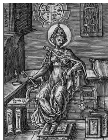
Obrázek je z díla »Quinta essentia« od Leonharda Thurneissera, 1570.

»Naším záměrem je hovořit jen k našinci, pro něhož píšeme dostatečně srozumitelně. Nepíšeme všeobecně pro lidi. Nechceme totiž svůj záměr, myšlenky, srdce a svou mysl odkrýt a poskytnout hluchým; proto je obháníme mohutným zdímem a uzamykáme na klíč. Nicméně našinci to bude dostatečně srozumitelné« (PARACELUS III/3).