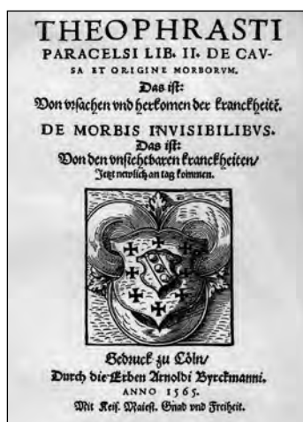
Titulní list Paracelsova pojednání »Von den unsichtbaren Krankheiten« s erbem Hohenheimů, 1565.

důkazy pro tuto domněnku ovšem chybí. Podle druhé byl prý Paracelsus alkoholik a spadl ze schodů. Konečně třetí verze tvrdí, že ho ze schodů shodili pohůnci salzburských lékařů. Nač tedy vlastně Paracelsus zemřel? Když umíral, stačil ještě nadiktovat závěť, o příčině smrti se však nezmínil.