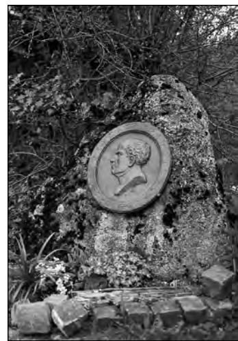
Pamětní kámen v Paracelsově rodišti.

Jako vandrující žák a řemeslník Paracelsus do roku 1524 prochodil celou Evropu. V tehdejší době byla učňovská léta, během nichž se cestovalo, něčím