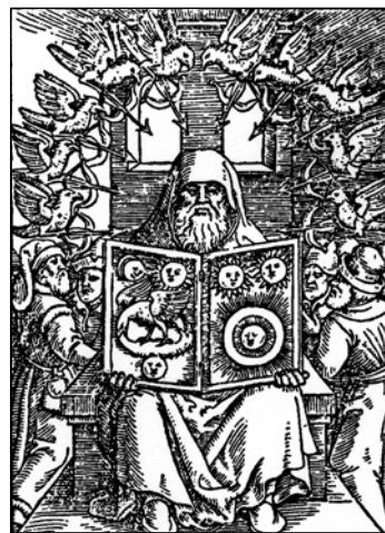
Hermes Trismegistos, původce hermetismu a alchymie. Dřevořez z r. 1566.

Kořeny Paracelsova světového názoru sahají až k prastaré nauce Herma Trismegista. Mnozí tohoto egyptského zasvěcence srovnávají s bohem Thovtem, nesoucím hlavu ibise a v egyptských mysterijních kultech uctívaným jako průvodce mrtvých, ochránce hledačů moudrosti či jako bůh zasvěcení. Řekové ho