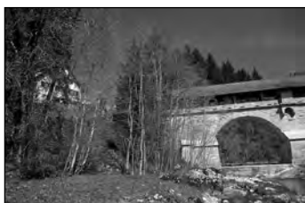
Paracelsův rodný dům vedle Čertova mostu u Einsiedelnu.

Navíc byl vynalezen knihtisk, který věděním do značné míry zpřístupnil i těm méně majetným. Paracelsův otec údajně vlastnil dobře vybavenou knihovnu, v níž si mladý Theophrast, později nazývaný Paracelsus, mohl osvojit první znalosti z filosofie, přírodovědy, medicíny a alchymie.