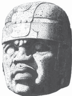
Obří kamenná hlava, jeden z nejcharakterističtějších a zároveň nejzáhadnějších projevů olmécké kultury

Mezoamerika byla osídlena již nejméně kolem roku 12 000 př. n. l., ale první civilizace se začala formovat asi před třemi tisíci lety poblíž Mexického zálivu. Jejimi nositeli byli tzv. Olmékové – toto jméno bylo ovšem tvůrcům kultury přisouzeno až dodatečně, a dodejme, že chybně, podle jednoho se současných kmenů této oblasti. O jméně, jímž se nositelé „olmécké“ kultury sami nazývali, ani o jejich historii totiž dnes nevíme nic. Veškeré informace pocházejí pouze z archeologických vykopávek jejich center v La Ventě a Tres Zapotes . Jisté je, že Olmékové rozvinuli intenzivní náboženský kult, jehož ústřední postavou bylo ↗ jaguáří božstvo, že jako vůbec první obyvatelé Mezoameriky užívali hieroglyfického ↗ písma a vypracovali také komplikovaný kalendář; a konečně že šlo o civilizaci zemědělskou, jakkoli