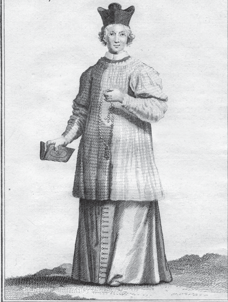
4. Chanoine Regulier de la Congregation de Latran, en habit ordinaire.