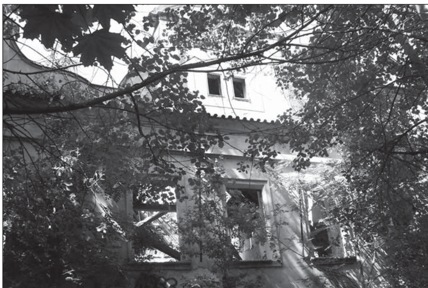
Usedlost Kajetánka v Praze-Břevnově (2008)

Největší dobrodinec theatinů, Bernard Ignác z Martinic, zemřel 7. 1. 1685 a byl pohřben v Martinické kapli katedrály sv. Víta. V souladu s jeho přáním