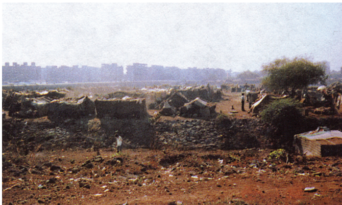
Hnízdiště občanů bombajských v Kurle (Indie)