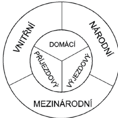
Obr. 2.2 Typy cestovního ruchu podle místa realizace (Zdroj: MMR, 2007)

Podle způsobu financování se dělí cestovní ruch na: