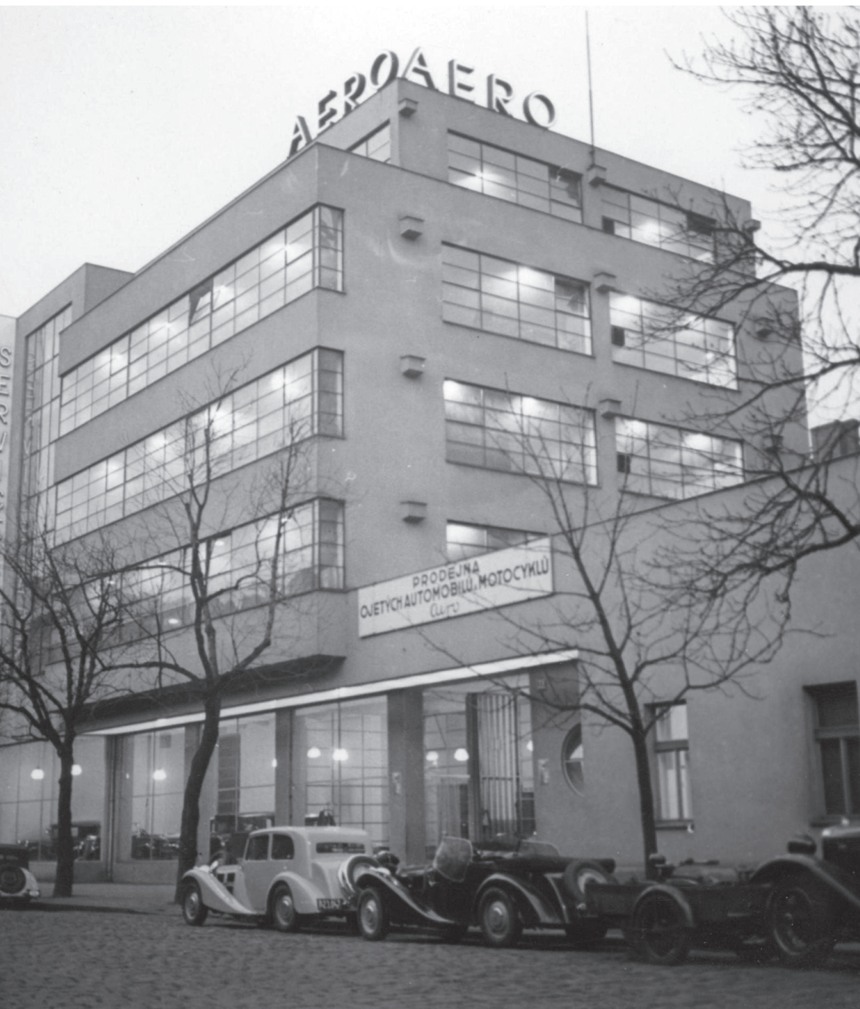
Nová budova Aero Service v Karlině