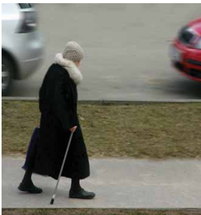
Obrázek 1.7: Ve skutečnosti nemá paní s auty nic společného. Ve snímku s ní tvoří obrazové prvky. Je na divákovi, jak si jejich vztah vysvětlí.