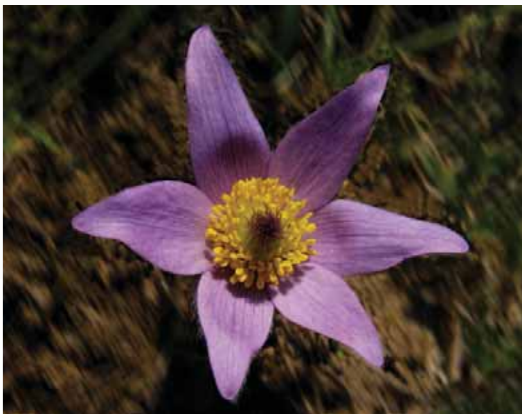
Obrázek 1.1: Figurou je reálný a ostrý květ.

Figura nemusí být na snímku celá, ale divák by měl mít možnost si její pokračování domyslet, pokud je to k pochopení obsahu snímku vůbec třeba.