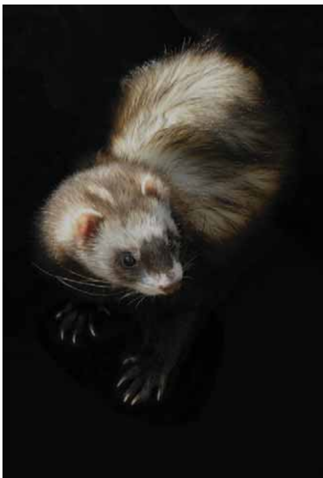
Obrázek 1.9: Světlá fretka na tmavém pozadí s patrnou texturou kožičku. Její dráčky jsou důležitým prvkem, neboť na nás přímo číhají.