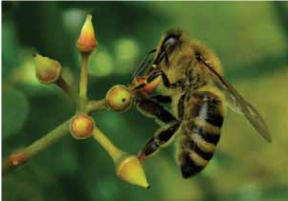
Obrázek 1.10: Prvky jsou rozmístěny po celé ploše obrazu. Včelu vyvažuje několik drobných květů.