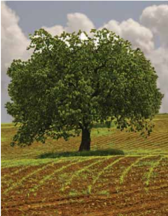
Obrázek 1.11: Fotogeničnost a symetrii stromu stojícího o samotě, podtrhuje porost ve tvaru zelených linií.