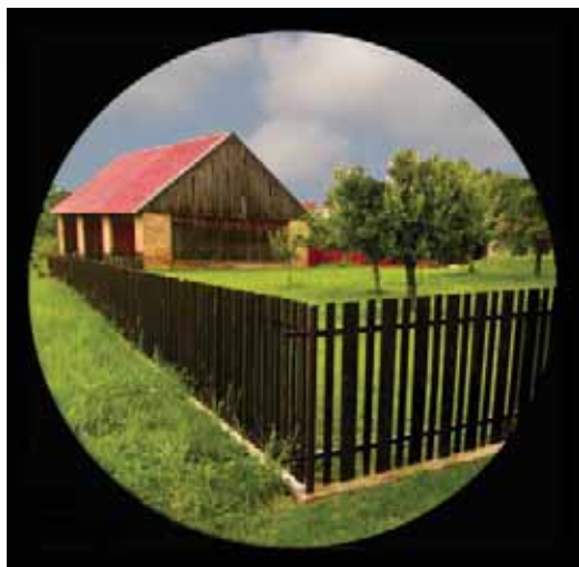
Obrázek 1.3: Polocelek krajiny, jehož rámovou symetrií narušuje rytmizace linií.