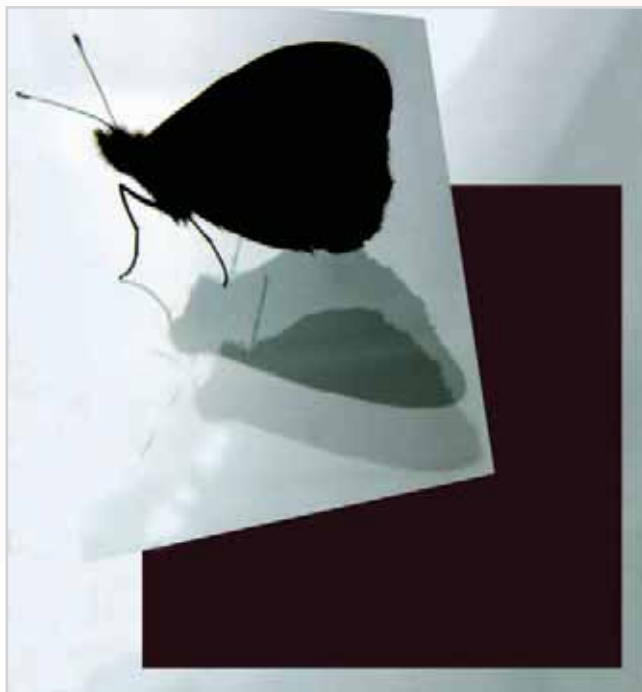
Obrázek 1.6: Víme, že jde o motýla, má tedy věcnou roli. Díraz je však kladen na roli výtvarnou, která převažuje u všech prvků ve snímku.