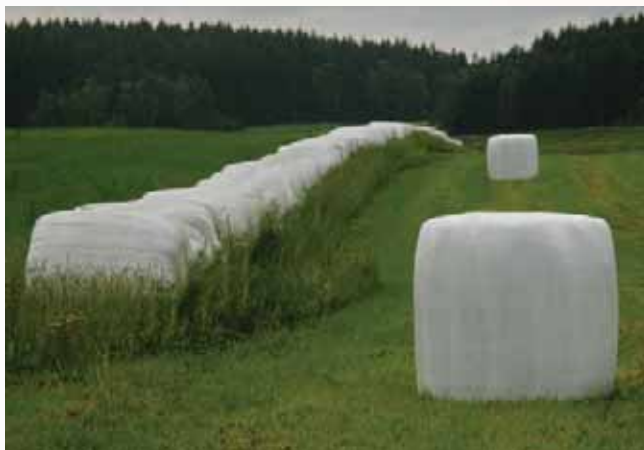
Obrázek 1.8: Nejblíže balík sena je měřítkem, umožňujícím odhadnout vzdálenost ostatních balíků i celé sestavy, tvořící šikmou linii a podporující prostorové uspořádání.