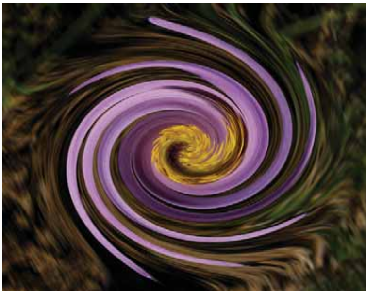
Obrázek 1.2: Příkaz v editoru počítače změnil květ v nefigurativní prvek – abstrakci.