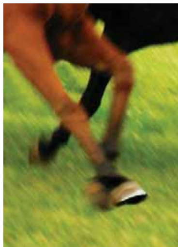
Obrázek 1.4: Ostrá část kopyta je zkratkou, která s dalšími prvky navozuje trysk koně.