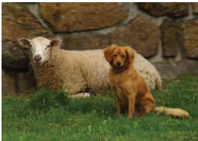
Obrázek 1.12: Jen mě uviděl s aparátem, šel „zapózoovat“ ke kamarádce ovci, jakoby věděl, oč zde kráčí. Hlavním motivem je pes a ovce, vpředu popředí a vzadu rozostřené pozadí.