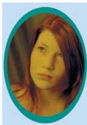
Obrázek 1.5: Portrét tvoří detail, který považujeme za uzavřený celek.

Princip role je uváděn jako základní kámen pro uspořádání prvků, tedy kompozici fotografického obrazu, která podporuje obsah snímku. Je-li prvek v obraze sám, je jeho role jiná, než když je součástí celku obrazu, kdy jednotlivé prvky vytvářejí vztah mezi sebou navzájem a mají vztah i k rámu obrazu.