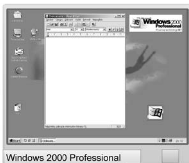
Windows 2000 Professional