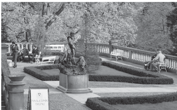
Obr. 1.9 Jižní terasa roku 2006, Konopiště

V letech 1970–74 byla terasa rekonstruována. Důvodem bylo pronikání vody až k izolaci kleneb a průsak vody zdmi. Počítalo se s odvodněním směrem ke schodišti. Nová hydroizolace měla být položena na novou betonovou vrstvu, jež ležela nad cihlami chránícími asfalt, a to v podobě tří asfaltových pásů. Pásky pak měly být chráněny potěrem, či deskami. Spádování bylo provedeno směrem k průčelí/balustrádě. Další fází představovalo vybudování odvodňovacího žlabu pro odvod přebytečné vody po obvodu. Opravy proběhly dle dokumentace jen částečně. Žulové pilíře byly ponechány, ostatní části (z červeného pískovce) rozebrány, rovněž tak značná část balustrády. Na rekonstrukci balustrády byl vypracován samostatný projekt, objednaný ale až v roce 1972. Balustrády tedy byly řešeny až po dokončení hydroizolace, proto se nezrealizovaly odtokové žlabky. Také směr odvodnění byl změněn. Odvod vody totiž nebylo možné dořešit, dokud nebyla dokončena rekonstrukce balustrád. Celá rekonstrukce probíhala celkem drasticky, ze 160 kůzelek na balustrádě jich bylo 130 zničeno. Totéž se týkalo madel, trnoží a sloupků. Schodiště bylo rovněž zdevastováno, sanace galerie nebyla zahrnuta. I přes veškeré stavební úpravy se již brzy po rekonstrukci objevily místní průsaky.