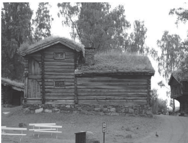
Obr. 1.3 Tradiční skandinávská střecha, muzeum v přírodě Lillehammer, Norsko, rok 2005

Konstrukce střech ve Skandinávii odpovídala výše uvedené technologii. Mocnost vrstvy tvořené travními drny činila cca 20 cm. Voda se ze střech odváděla pod okrajovým profilem, vydlabaným v okapovém trámu. Okapový trám uchycený dřevěným hákem byl kotven k přesahující krokvi. Takové střechy měly tradičně sklon 30–45°, jejich životnost byla podle četnosti dešťových srážek v oblasti cca 20–40 let.