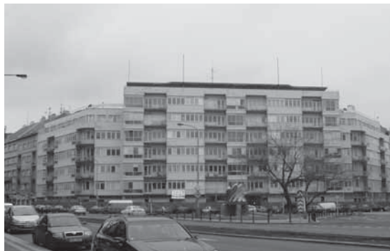
Obr. 1.11 Skleněný palác, Praha 6, rok 2006

Skleněný palác v Praze 6 – Bubenči nazývaný též Domy zemské banky či Skleněný dům je reprezentativní budovou této městské části. Nachází se na náměstí Svobody 1, mezi vyústěním ulic Československé armády a Terronské. Jde o komplex pěti domů, jež mají společný vchod, třístranné průčelí, suterénní parkoviště a plochou ozeleněnou střechu.