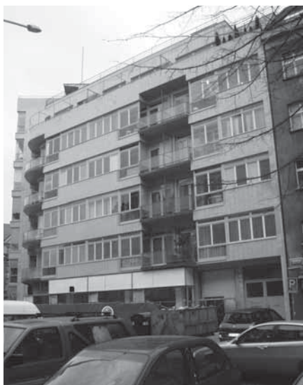
Obr. 1.12 Skleněný palác, Praha 6, rok 2006

Prizemí budovy bylo po určitý čas využíváno pro komerční účely. Protože původní obřadní síň už nevyhovovala moderním požadavkům, byl zpracován nový návrh na obřadní síň. Jedním z architektů je Petr Bouřil z ateliéru ABM. Rekonstrukce proběhla v letech 2001–2007 a zahrnovala vstupní halu a přízemní chodby „Skleňáku“. Cílem bylo co nejšetrněji prostory restaurovat, a to včetně uměleckých děl (na stěnách plastiky ženských figur od Jana Laudy, skulptura ženy a dítěte od Bedřicha Stefana, vitráže na dveřích od Jana Baucha z roku 1937 /za účasti Umělecko-přírodovědného muzea/ aj.). Veškeré práce probíhaly za dohledu Národního památkového ústavu. Místo obřadní síň na levé straně vznikla kavárna, která je schopna pojmout až 60 hostů. V této části zůstaly zachovány dva obchody – květinářství a vinotéka. Do pravé strany je situována nová obřadní síň.