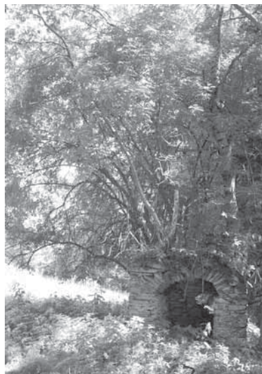
Obr. 1.2 Přirozené osidlování stavby vegetací, Šumava, rok 2006

Konstrukce založené na této technologii nejsou pro vodu zcela nepropustné, a tak zejména v oblastech častějších a vydatnějších srážek bylo třeba pro urychlení odtoku vody ze střešní plochy volit střechy s větším sklonem tak, aby nedocházelo k jejich podmačení. Větší sklon měl za následek, že na 1 m 2 střešní plochy dopadalo menší množství srážek a ty, které dopadly, po střeše rychleji stékaly. Bylo však nutné najít takové kompromisní řešení, aby sklon nebyl příliš strmý, neboť v takovém případě dochází ke zvýšenému působení vodní a větrné eroze na vrchní vrstvy vegetačního souvrství. K boji proti promočení přispíval také použitý materiál – rašelina, která v naprosto suchém stavu nesaje vodu.