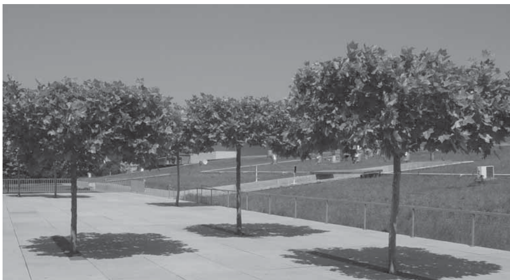
Obr. 1.14 KOC Nový Smíchov – vzrostlé tvarované platany, Praha 5, rok 2006

Hlavní plocha má spád 12 %, a to až v délce 42 m.