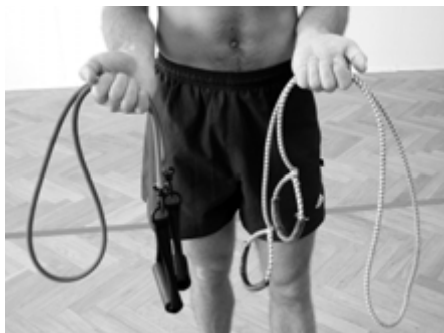
Tub expander a opletený expander

Expander je specifická cvičební pomůcka. Při cvičení s ním nedochází jen k izolovanému zvýšení zatížení posilované svalové partie, ale zároveň se nepřímo zatěžují i další svaly. Tak např. při posilování šikmých břišních svalů nedochází jen k zatížení tohoto jednoho svalu, ale také k zatížení bicepsu, prsního svalu, deltového svalu a mnoha dalších. Z tohoto důvodu nenajdete v kapitole posilování s expanderem klasické rozdělení a zaměření posilování na jednu svalovou partii, protože při každém cviku je posilována celá svalová skupina.