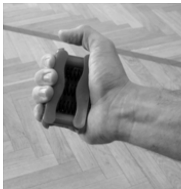
Posilovač svalů předloktí

Vhodnými pomůckami pro posilování doma jsou samozřejmě i běžné předměty, např. židle, stůl, dveře, postel a samozřejmě koberce , který používáme často místo podložky. Můžeme na něm odcvičit 90 % všech cviků.