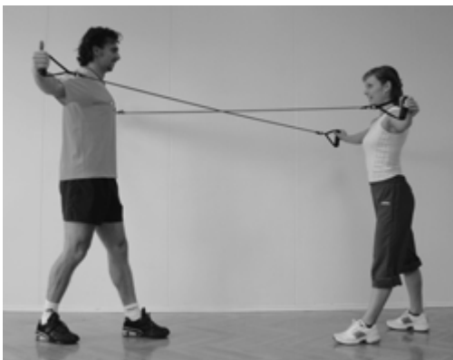
Cvičení s expanderem ve dvojici

prvků. V praktické části nejsou uvedeny žádné cviky s uchycením a ve dvojici, kde se dá experimentovat ještě více. Především cvičení ve dvojici je nejen účinné, ale také zábavné. Nemusí totiž jít jen o dvojice, je možné na sebe navázat několik expanderů a tak si zaposilovat ve větší skupince.