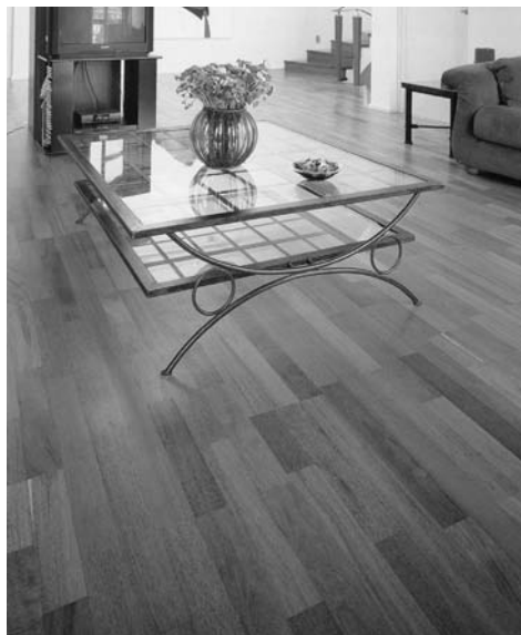
Dřevěná lamelová podlaha z merbau působí ve světlém interiéru elegantně (Empiri Wood design)

Podobně není dřevěná podlaha rozumným řešením do vlhkých prostor a tam, kde se manipuluje s vodou, například v kuchyni. Stává se, že se nechtěně vylije tekutina přímo na zem. Pokud ji ihned neseřeme hadrem, zateče do spár a podlaha se následně zvlní a vzduje. Do kuchyně lze