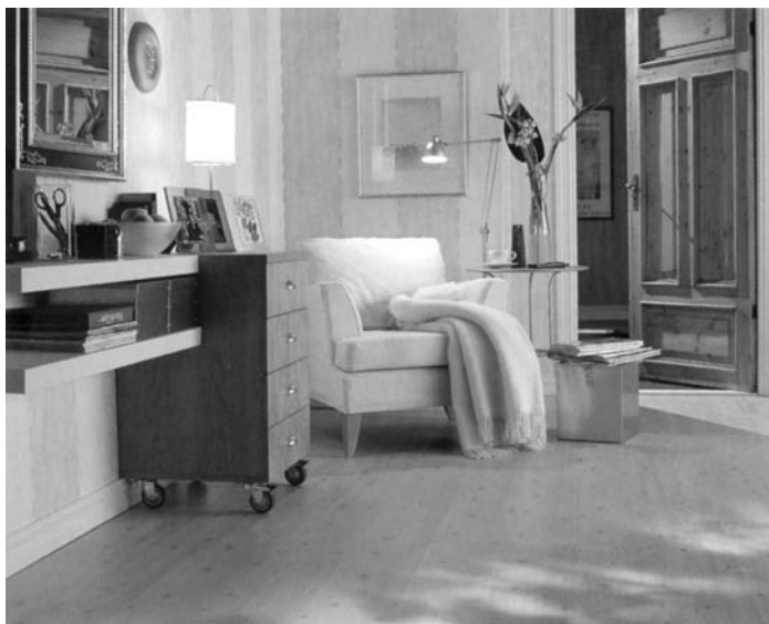
Dřevěná palubková podlaha z měkkého smrkového dřeva

Palubkové (prkenné) dřevěné podlahy, které známe ze starých venkovských chalup, se opět začínají vracet do módy. A to je dobře.