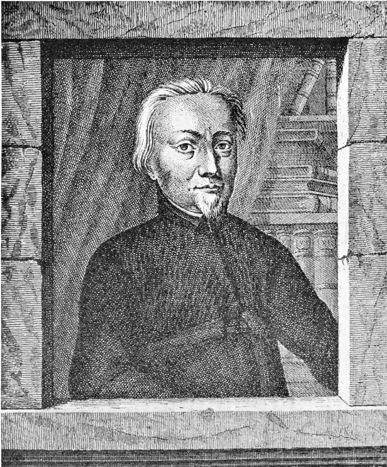
Bohuslav Balbín SJ (1621–1688)