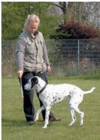
Klik za pohyb směrem k targetu.