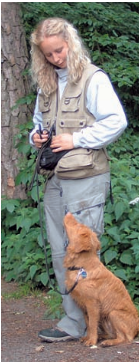
Obedienci můžete trénovat už se štěnětem.

Obedienci můžeme trénovat se psem již od věku osmi týdnů. Právě oční kontakt a korektní sed u nohy jsou jednoduché úlohy, které se může naučit každé štěně. Doba, po kterou cvičení trvají, musí být samozřejmě velmi krátká. Zejména pracovním plemenům však obedience nabízí krásnou příležitost, jak se zaměstnat v prvním roce života, kdy je ještě nechceme fyzicky a psychicky zatěžovat rychlými a stresujícími druhy sportů, jako jsou agility, disc dogging a jiné.