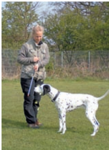
Klik za pohled k targetu.

Podržte target psovi před čenichem a pomalu s ním pohybuje. Ze zvědavosti do něj většinou okamžitě štouchne. Na tuto jeho první snahu zareagujte každopádně kliknutím! Dál už to bude pravděpodobně těžší. Musíte psa odměnit kliknutím za každý sebemenší pohled směrem k targetu, až se o něj bude stále více